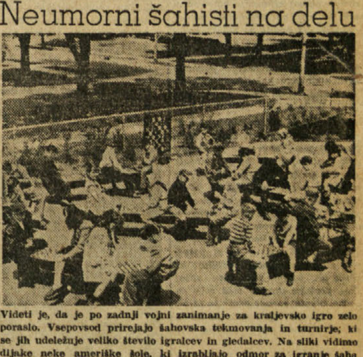
Videti je, da je po zadnji vojni zanimanje za kraljevsko igro zelo poraslo. Vseposvobod prirejanje šahovske tekmovalnja in turnirje; ki se jih udeležuje veliko število igralcev in gledalcev. Na sliki vidimo dljake neke ameriške šole, ki izrabljajo odmor za igranje šaha.