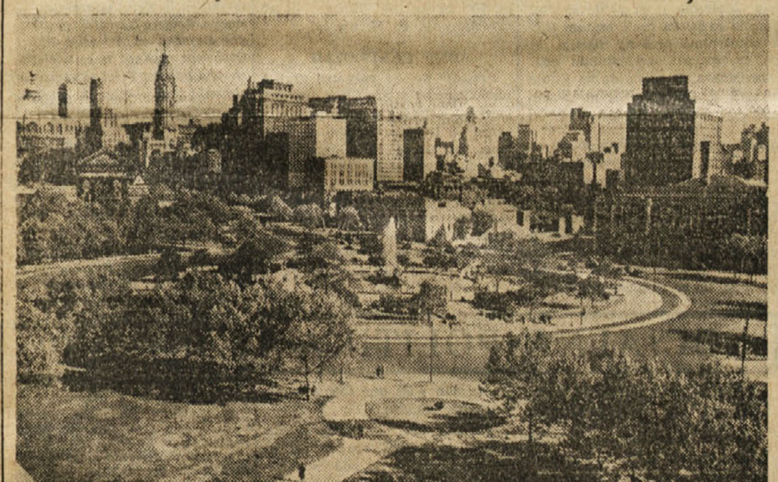
Mirno ameriško mesto Filadelfija je prenehalo biti mesto kvekerjev že prav za prav leta 1760, ko so v mestu prevladali angleški protestanti, škotski presbiterijanci ter Irci. Danes jih ni več kot le kakih 15.000 ter se posebnega kvekerjskega jezika poslužuje edino v ozkem družinskem krogu. Danes prekladujejo katoličani in protestanti, dasi uspeva tudi še nešteto drugih verskih sekt; v mestu je več cerkva kot v katerem koli drugem večjem ameriškem mestu. Slika predstavlja moderno mestno delo z orjaki in nebotalni in s krasnim parkom v ospredju.