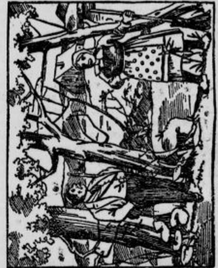
Kje je moj prijatelj?

in sicer kranjiče eksportne in A. Znidaršičeve. Tudi več škafov hnega točenega MEDU. Cene po dogovoru. J. ROZMAN, čebelar, Britof p. Kranja.