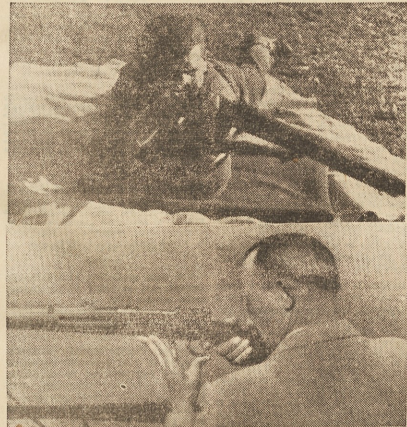
Zgornja slika prikazuje pravilno držo puške leže s pomočjo jermena, spodnja pa pravilno držo v stojećem stavu