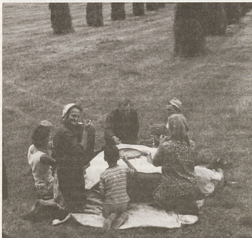
Pri "južini" ob košnji na rovtu na Poljani pod Korenskimi sedlom (foto: A. Novak, 1972).

V študentskih letih smo šteli za velik premik v etnologiji Strukturo slovenske ljudske kulture prof. Vilka Novaka. Sedemdeseta in osemdeseta leta so zaznamovana z velikimi premiki v naši stroki na teoretičnem in organizacijskem področju. To je čas združevanja strokovnih energij, generacij, prepletanja in konfrontacij različnih pogledov na stroko, čas skupnih projektov, žive publicistične dejavnosti in čas afirmacije etnologije v širši družbeni zavesti. Sodobna slovenska etnološka misel