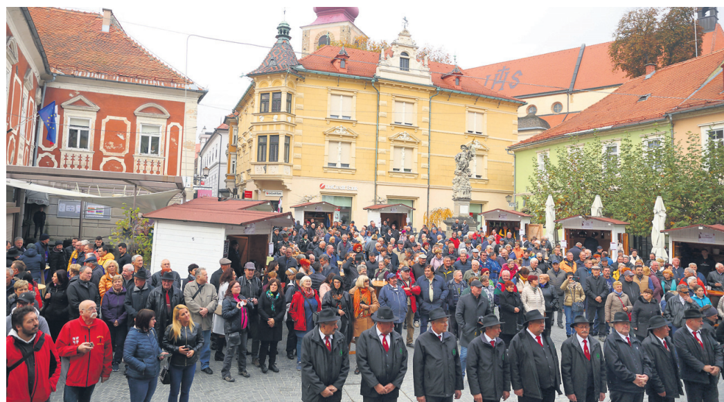
Na martinovo se začne mali fašenk.