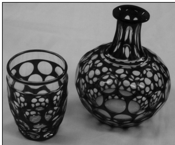
Steklenica za vodo s poveznjenim kozarcem (št. 6).

bogato okrašene, kot je tudi ta primer: na brezbarvno osnovo je platirano prozorno kobaltno steklo, ploskovni vzorec plitkih okroglih leč je okrasno vbrusen. Podobno okrašena (platirana in okrasno obrušena) je tudi kobaltno modra doza s pokrovom št. 64. Glede na to, da je sorazmerno nizka, a precej široka, je verjetno služila kot shranilo za telesni ali ličilni puder na toaletni mizici.