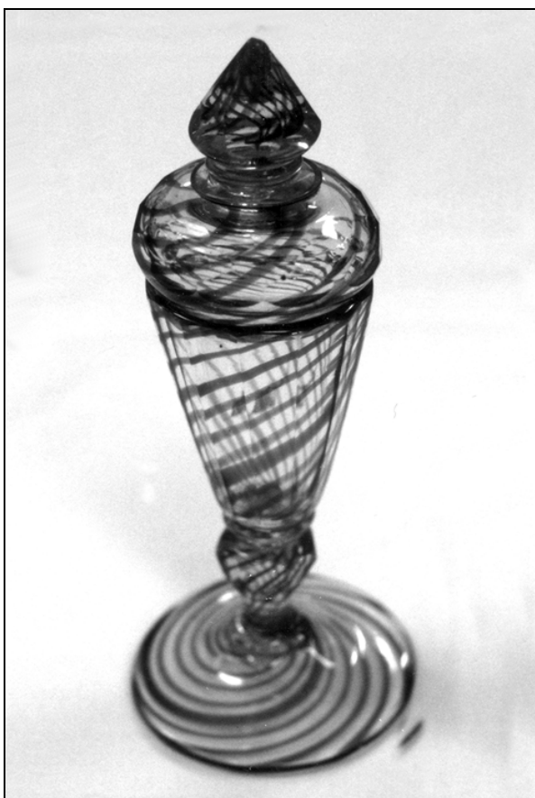
Št. 50