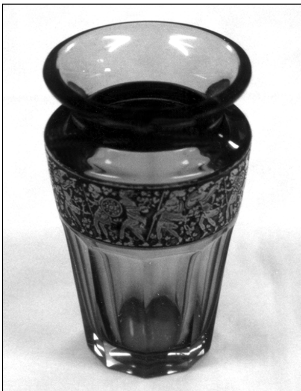
Vazica iz jantarjevo rjave steklene mase (št. 46).

Steklenina s št. 46, 47, 48 je izdelana iz jantarjevo ali topazno rjavega prozornega stekla ali pa je platirana z njim. V modo je prišlo v dvajsetih in tridesetih letih 20. stoletja kot masa ali barvna plast za oblikovanje in krašenje zahtevnejših kosov. Oblikovno obrušeno vazico št. 46 iz jantarjevo rjave steklene mase krasi pod ramo srebrnkast pas, ki s svojim dekorjem povzema dragoceno kovinarsko okrasno tehniko niello . Karafa s čepom št. 47 in kozarec št. 48 pa sta platirana. Okrasje ( rocailles in jelen v gozdu) je motno vgravirano do brezbarvne osnove in s tem je dosežena mikavna belorumen kombinacija.