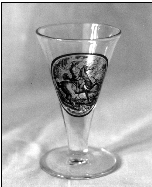
Kozarec iz velikega servisa za različne pijače (št. 19*).

Pri št. 18 – servisu za žganje – je zanimiva tako motivika poslikave kot tudi njena porazdelitev: celotni prizor lova na lisico je na steklenici, na kozarčkih pa so posamezni motivi. Znano je, da so tudi steklarne v Sloveniji prevzemale naročila za poslikavo servisov in pri izbiri motivov upoštevale želje naročnikov. Veliki servis za različne pijače št. 19* povzema po sestavu potovalne garniture oziroma garniture, ki so jih po halaliju prinesli v posebej zanj izdelanemu kovčku v gozd, na kraj, kjer je bil zložen lovski plen. Prizmatične steklenice, kozarce, tumblerje, kozarce in šilca na nizki nogi krasijo na obodih medaljoni s pretiski lovskih prizorov v slogu bakrorezov 18. stoletja.