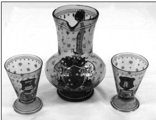
Št. 4