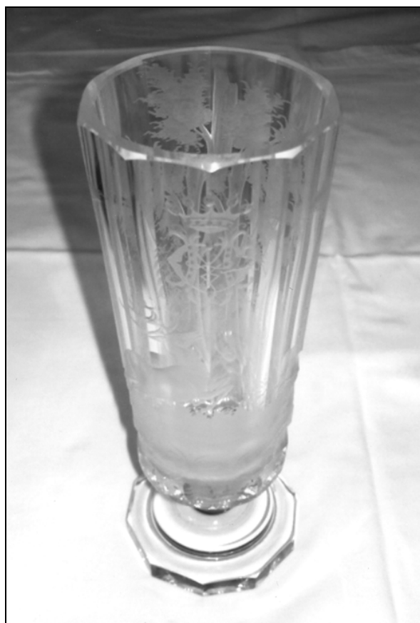
Št. 33