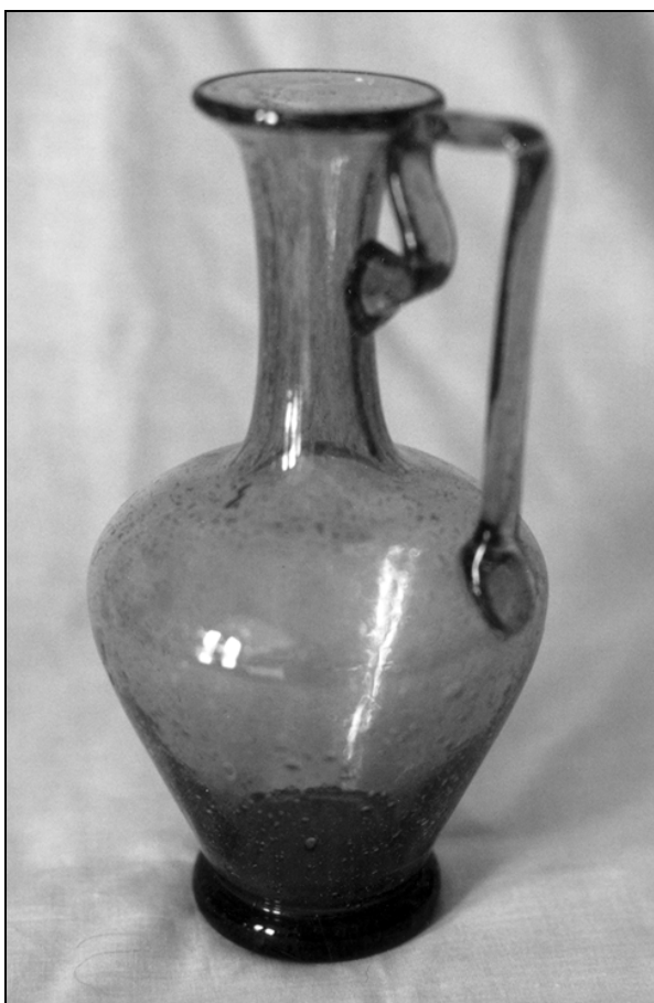
Št. 21*