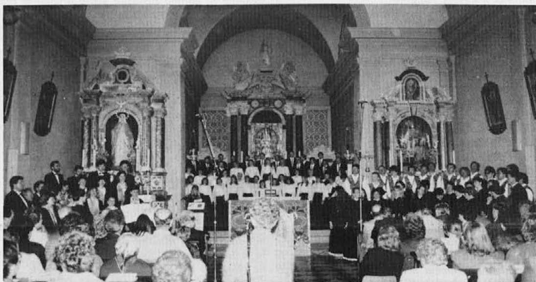
Koncert v župnijski cerkvi v Podgori. Ob levem stranskem oltarju zbor Gallus iz Kranja, v prezbiteriju zbor Gallus iz Buenos Airesa, ob desnem stranskem oltarju zbor »Podgora«