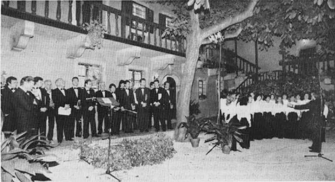
Terčonova domačija v Slivnem. Zbor Fantje izpod Grmade in Dekliški zbor Devin (ft. D. Križmančič)

Prva sobota v letošnjem juniju bo še zelo dolgo nepozabna za vse, ki smo se o nena dne pod večer zbrali na romantično lepem dvorišču gostoljubne Terčonove domačije v Slivnem. Tam smo se namreč z odprtim srcem in z navdušenim ploskanjem zahvalili Fantom izpod Grmade za njihovo petje, ki so nam ga 25 let razdajali iz prijateljskega in slovenskega srca.