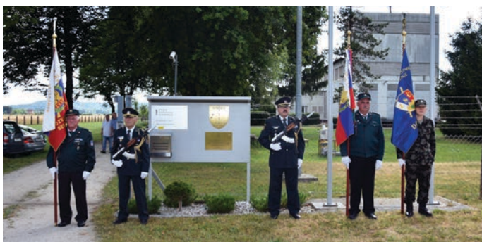
Počastitev spomina na rojstvo naše države