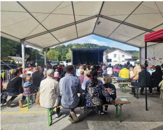
Najmlajšim šolarjem so na ploščadi pred Kulturnim domom Trzin prvi prestop šolskega praga popestrili s kulturno prireditvijo. Starši so za spremstvo prvošolca dobili dodaten dan dopusta.

Na šoli pa je bil tudi med poletnimi počitnicami direndaj, a ne otroški. »V poletnih mesecih julija in avgusta je potekala velika sanacija, saj smo zamenjali vodovodne cevi in posledično tudi tlake v šolski jedilnici in na spodnjem hodniku. Šola je tako v tem predelu dobila povsem novo, zelo lepo podobo. Šolske hodnike bomo popestrili z likovnimi deli, fotografijami učencev ter ob kemijski učilnici uredili stekleno vitrino za razstave izdelkov. Učilnica likovne in glasbene umetnosti bo dobila nove dvizne mize in stole za lažje prilagajanje pouka novim učnim metodam in oblikam,« nam je povedala ravnateljica.