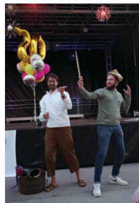
Ulična predstava Legenda o Erazmu Predjamskem

Predstava nas je dodobra nasmejala, potem pa smo skočili v plesno-cirkuške vode in obstali odprtih ust ob predstavi Oni v izvedbi Plesnega kluba Kazina, v kateri so plesalci izvajali vratolomne akrobacije, žonglirali, skandirali in postavili celo človeško piramido, na vrhu katere je žonglirala ena od plesalk. Resnično navdušujoča in aktualna predstava!