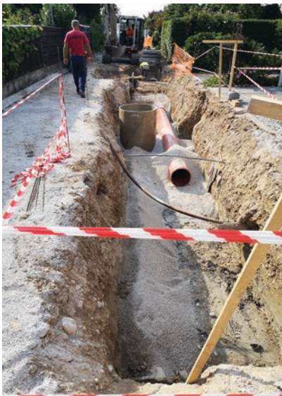
Investicijsko vzdrževalna dela na vodovodu, kanalizaciji in vodovodnih priključkih v Prešernovi ulici

V poletnih mesecih so potekala tudi investicijsko-vzdrževalna dela na vodovodu, kanalizaciji in vodovodnih priključkih v Prešernovi ulici, ki se v septembru, ko je nastajal ta prispevek, še niso končala. »V okviru te naložbe so predvidena dela v Prešernovi ulici od objekta s hišno številko 13 do konca ulice, in sicer obnova vodovoda v dolžini 380 m, obnova kanalizacije v dolžini približno 410 m, obnova 12 vodovodnih priključkov in prevezava 48 vodovodnih priključkov, prevezava 16 kanalizacijskih priključkov, obnova približno 270 metrov ceste, obnova javne razsvetljave v dolžini približno 325 metrov,« smo izvedeli od Torkarja.