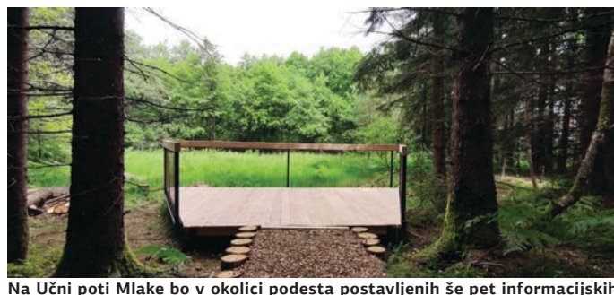
Na Učni poti Mlake bo v okolici podesta postavljenih še pet informacijskih točk na temo mokrišč.