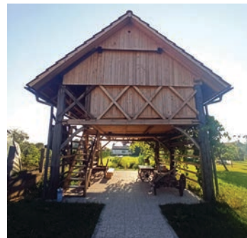
Muzej na prostem že gosti številne dogodke.