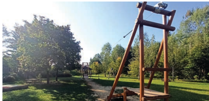
Žičnica v športno rekreativnem parku Mlake

»V športno rekreativnem parku Trzin Mlake smo namestili zunanjo mizo za namizni tenis,« je povedal Erčulj. Novost, ki so se jo razveselili številni trzinski otroci, pa je igralo vlečnica. »Zamenjali smo tudi dve košarkarski tabli in vrtiljak,« je še poročal Erčulj in dodal, da so dela potekala tudi v šoli. »V Osnovni šoli Trzin smo zamenjali glavno vodovodno cev in prenovili tla na spodnjem hodniku in v jedilnici.«