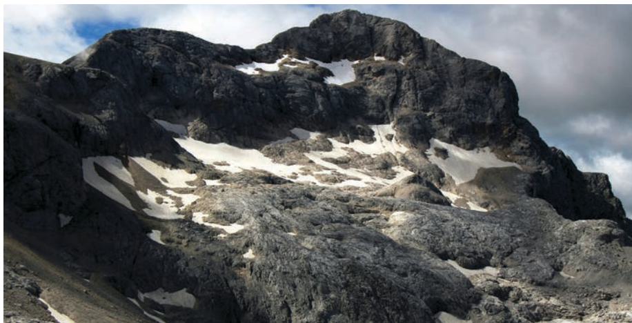
Eno najtoplejših poletij ni prišlo do živnega snežišča v okolici Triglavskega ledenika (na levi), ki so na območju Triglavskih podov vztrajala tudi še na začetku jeseni. Zadnja snežna sezona je bila res obilna.