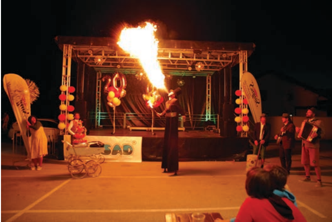
Zabava z glasbeniki iz Suhega cvetja

Lučka je v spremstvu čarodeja na hoduljah prifrčala z velikaaaansko regratovo lučko, in ko smo ji zapeli »vse najboljše«, sta sledila še bruhanje ognja in ognjemet iz klobuka. Stari in mladi smo se nato posladkali z unikatno lizika torto in nadaljevali veseljačenje z zabavnim programom glasbenikov iz Suhega cvetja.