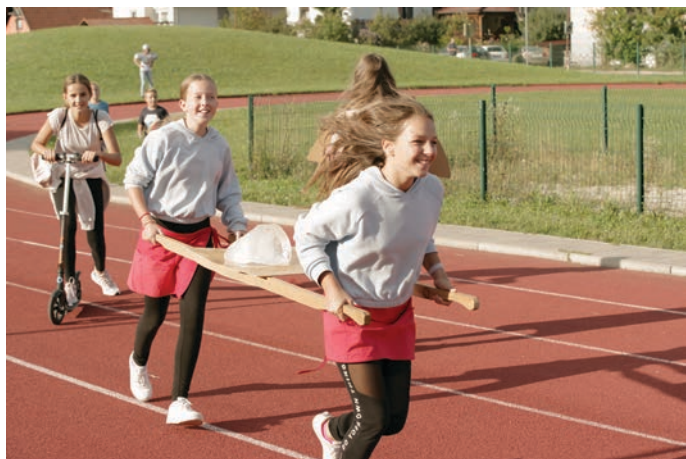
Ledena dirka je letos k sodelovanju privabila deset ekip.

V petih festivalskih dneh, ki so se zvrstili v tednu dni, smo pripravili kar 12 dogodkov, začenši z Ledeno dirko, v kateri se je letos pomerilo deset ekip.