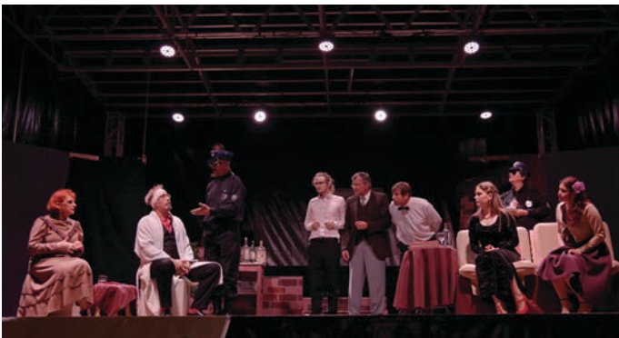
Gledališka predstava Govorice

Torek, zadnji dan avgusta, je bil mirnejši. Po dolgem premoru od lanskega marca je bila znova na sporedu gledališka predstava, komedija Govorice v izvedbi Kulturnega društva Bohinjska Bela.