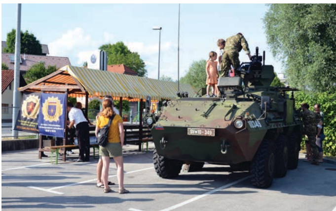
Pred slovesnostjo je bil na parkirišču pri Avto Debec mogoč ogled dela policijske in vojaške tehnike.

Daljši je bil govor slavnostnega govornika prireditve, predsednika vlade RS, Janeza Janše, v katerem se je spomnil prelomnih dogodkov pred tridesetimi leti: na ta dan je takrat na različnih koncih Slovenije hkrati potekalo 75 različno intenzivnih oboroženih spopadov. Za