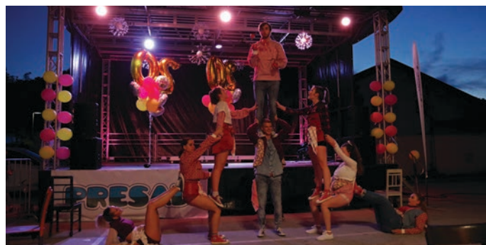
Človeška piramida v izvedbi Plesnega kluba Kazina