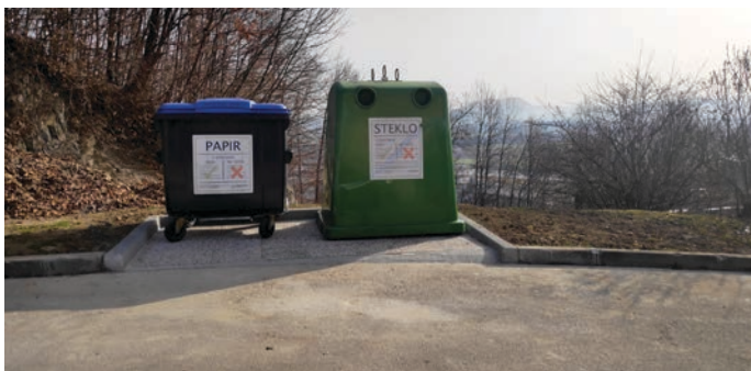
Ekološki otok Onger