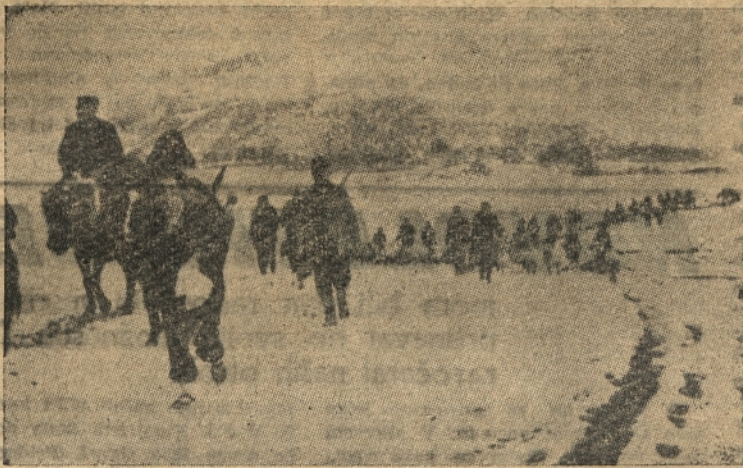
Ze od vsega začetka je ljudstvo spremljalo Jugoslovansko armado. Na sliki vidite, kako se ljudstvo umika skupaj s četrto črnogorsko brigado

Jugoslovanska armada, naš ponos in najzaneslivejši čuvar naše svobode, neodvisnosti ter izgradnje socializma, je 22. t. m. praznovala svoj tradicionalni Dan v spomin na usta-