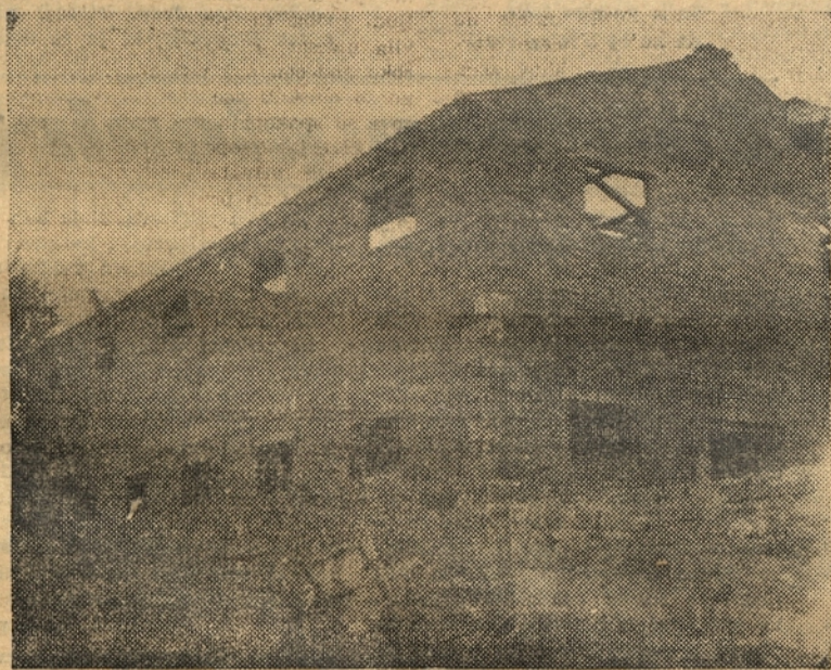
Zivinski hlev KDZ v Babičih bo kmalu sprejel 50 glav živine pod svojo streho

Opazoval sem kmeta, ki je imel na njivi veliko in gosto travo. Nekega jesenskega jutra je naložil gnojilo in ga odpeljal na njivo. Na travi je bila rosa. Gnoj je potrosil ne na zemljo, ampak na travo. Opazil se je močan duh, ko se je gnojilo razkrajalo. Šele po več dnevih, ko je bila trava vsa ožgana, je začelo vse skupaj padati na zemljo. Tukaj je bilo uničenega mnogo sena. Gnojilo pa je padlo na zemljo že v okameneli obliki. V takih primerih bi morali travo prej pokositi in pograbit ter šele nato trositi gnojilo. Če tega ne storimo, pa bi morali travnike v suhem vremenu pobranati, potrositi gnojilo in zopet pobranati, da se gnojilo pokrije z zemljo, saj je zemlji namenjeno.