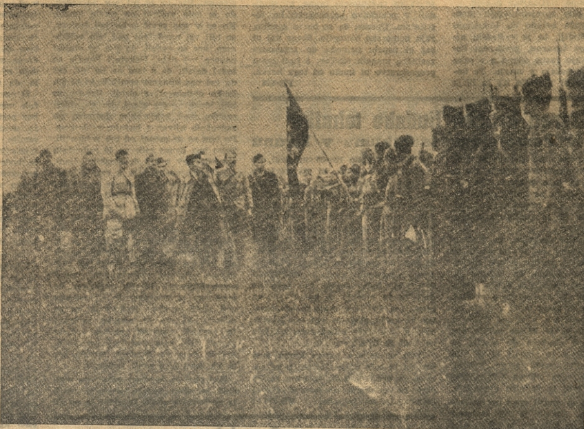
Predaja zastave 1. proleterski brigadi v Bosanskem Petrovcu

vest, da je Komunistična Partija in njihov vrhovni komandant maršal Tito in vse ljudstvo na pravi poti, da je njihova pot v socializem prava. Vojsko, ki je zrastle iz ljudstva v srđiti revolucionarni borbi, ni mogoče prestrašiti, še manj ukloniti. Jugoslovanska armada stoji danes trdno na braniku miru — njena moč in krepitev pa sta velik pobornik miru v svetu.