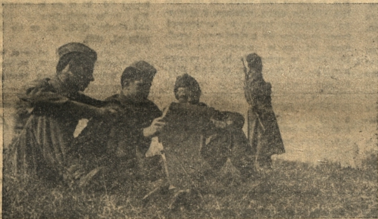
JA — budni čuvar meje socialistične Jugoslavije. Borci se usposabljajo v voj. tehniki. Najdejo pa tudi dovolj časa za čitanje časopisov in razvedrilo

Te številke so dovolj zgovorne. Kažejo, kako silno je porasla naša gospodarska aktivnost v zadnjem letu in kako je naš enoletni plan mobiliziral vse naše gospodarske sile. Nove in nove stotine oseb, zlasti iz naših mest, ki so bile še lani izven produkcije, so se vključile v naše gospodarsko življenje in v borbo za socialistično izgradnjo. Če vzamemo porast prometa in porast zaposlitve kot merilo povečanja naše aktivnosti na gospodarskih področjih, ki jih v glavnem zajema naš enoletni plan, potem bi lahko rekli, da se je naša aktivnost letos povečala za okoli 40 %. To je velik skok, ki tudi kaže, da smo letos napravili velik korak naprej v našem gospodarstvu.