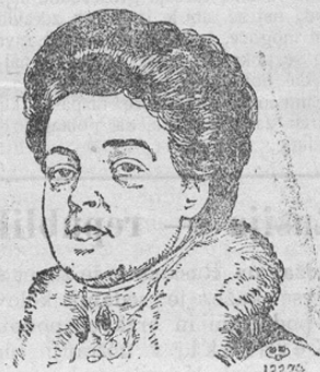
Königin Eleonore von Bulgarien †.

Umrla je soproga poštenega našega zaveznika bolgarskega kralja Ferdinanda. Pokojnica je bila velikodušna kraljica in blaga žena. Na strani svojega kraljevskega vladarja, ki nam je zvesti prijatelj in zaveznik, preživela je težke čase prve in druge balkanske vojne. Doživela pa ni konečne zmage, ki boče tudi bolgarskemu kralju prinesla mogočno bodočnost. Umrla kraljica Eleonora pa je bila tudi prava mati svoji državi. Zato joka ob njeni gomili ves bolgarski narod, pa tudi mi zavezniki čutimo vso pretresljivo žalost te prerane smrti.