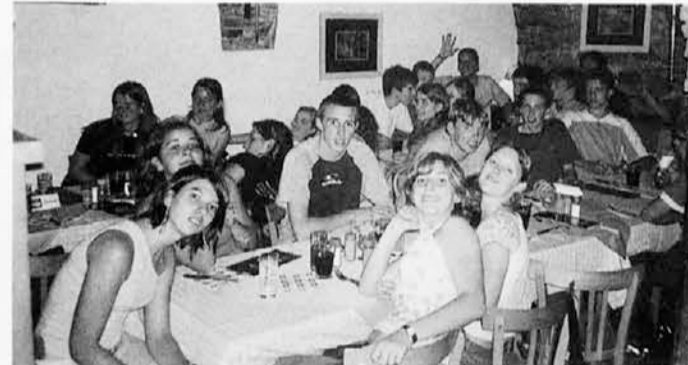
Kosilo v Ljubljani