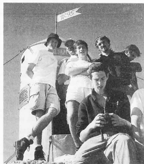
Pri Aljaževem stolpu

Po tem sprehodu smo se odpravili na Koroško. Tam smo bili kar tri dni, to se pravi do srede. Stanovali smo na Rebrci. Ogledali smo si Mohorjevo družbo v Ce-