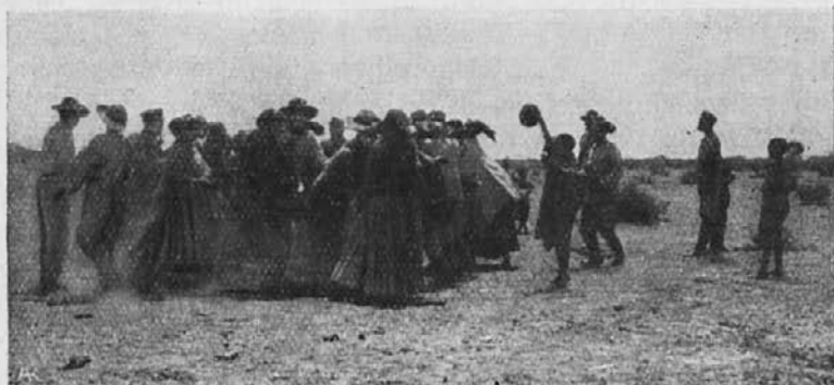
Gledališče in plesi pri Hotentotih v Namaqua-deželi.