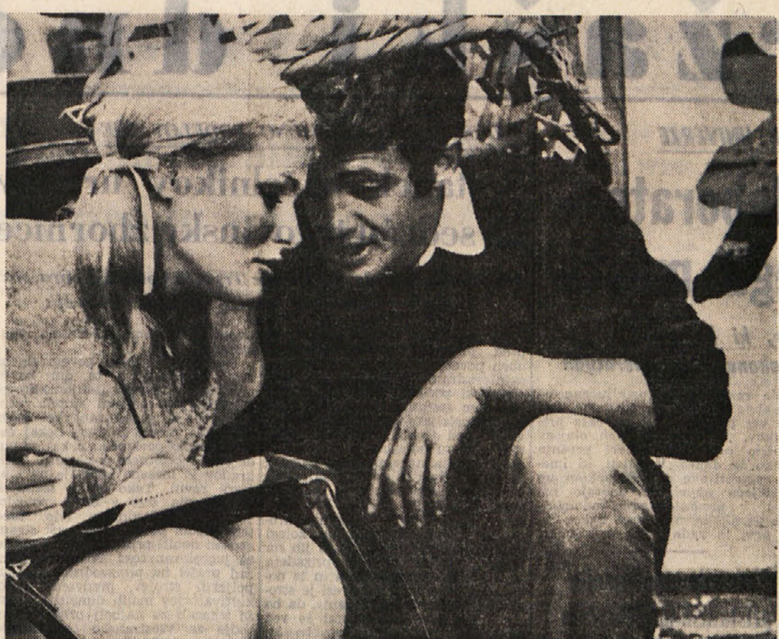
Francoskega filmskega umetnika Belmonda pogosto videvajo v družbi lepe Ursule Andrews. Pred davnim je celo zanemaril neko družinsko slavo in se sestal z Ursulo v Londonu, kjer je ona igrala v filmu 'The blue Max'

Po kakšnih poteh se bo zdaj razvijala politična situacija v Dahomeju, je vprašanje, ki nanj trenutno ni moč odgovoriti. So pa politični opazovalci, kar zadeva zunanje-politično področje, opazili naslednje značilnosti: ko je general Soglo pretekli mesec prišel na predsedniški sprejem, ki so ga sprejeli predsednik republike Apitiya in Ahomadegbeja, da sta podala ostavko, je Čangkajskova vlada nemudoma stopila v stik s Kotomnom in zaprosila za ponovno vzpostavitev diplomatskih odnosov, ki jih je dahomejska vlada po dogodkih novembra leta 1963, ko je bila priznala Kitajsko, pretrgala. Zda je s tem v zvezi prišlo do bistvene spremembe, v zvezi s katero je Peking tudi zahteval pojasnilo. Sicer pa je stvar znana: general Soglo je osebni prijatelj Čangkajška, saj je zadnja leta bil že nekajkrat njegov gost v Tajpehu.