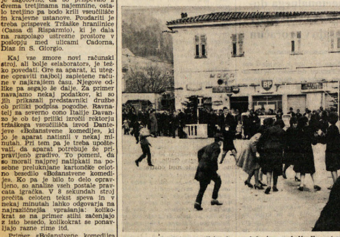
Prizor z letošnjega tradicionalnega «lučanja» na boljunškem trgu

Z motorizacijo izgubila božič značaj «družinskega praznika» in vedno bolj se razvija množično zapuščanje mesta na bližnja smučišča