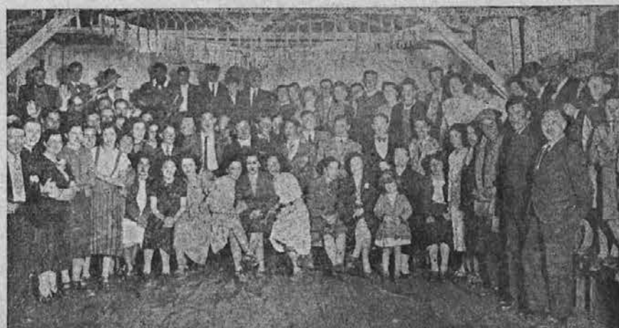
S prireditev Jugoslovanskega podpornega društva v Tandilu

Opozarja se, da se posebnih vabil ne bo razpošiljalo.