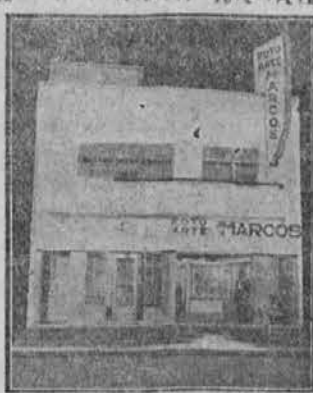
Facundo Quiroga 132a U. T. 22 - 8327 DOCK SUD