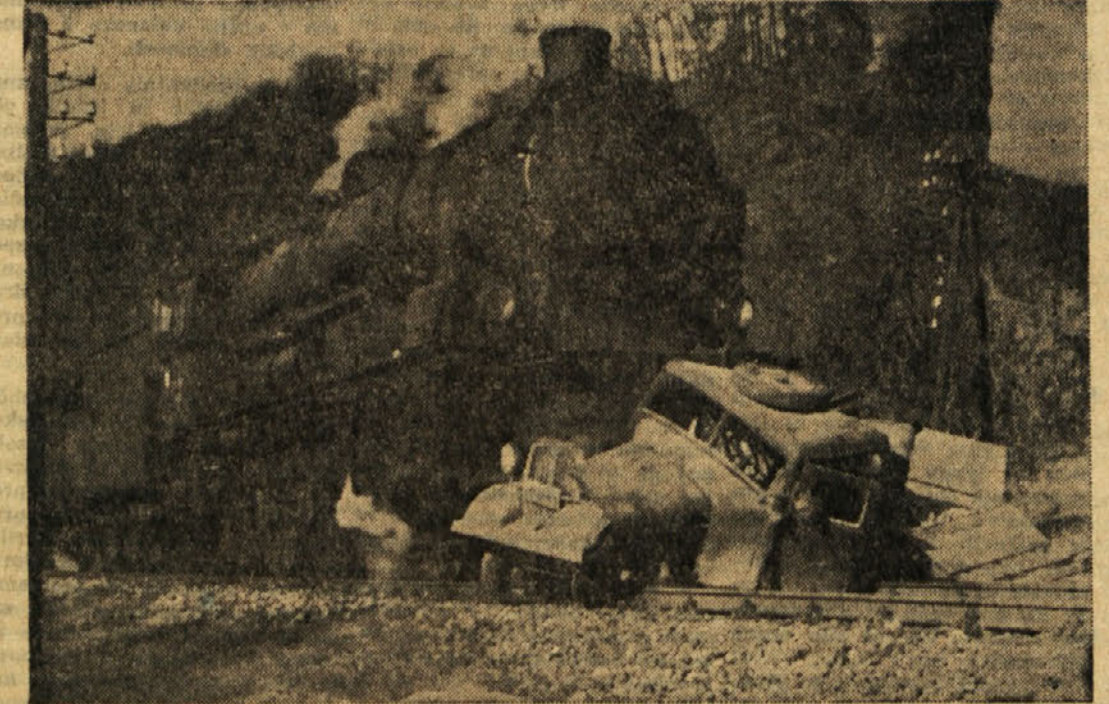
Železniška nesreča na prelazu v Blanci. V zadnjem času je bilo v Zasavju že več prometnih nesreč, ki so terjale tudi človeška življenja

manjkale razne delavnice, garaže, skladišča in še drugi prostori, ki so osnovni pogoj za normalno obratovanje in delo. Letos je bil v tem pogledu storjen velik korak naprej: zgradila so se primerna skladišča in upravni prostor; komunalne uprave, prav tako je bila med glavnimi nalogami komunalne uprave ureditev in izpopolnitev mestnega vodovoda ker je zaradi porasta prebivalstva v povojnih letih v trboveljski dolini zlasti ob sušnih mesecih začelo pomanjkovati dobre pitne vode. Skoro eno leto so trajala raziskovalna dela za zajetje novih studencev pod Partizanskim vrhom in na Vrheh, prav tako zgradnja prpadajočega vodovoda, ki je sedaj vključen v mestno vodovodno omrežje. — Pa tudi ostala obrtna podjetja v komunalnem gospodarstvu so dobro delovala, da omenimo n. pr. mestni kaminolom, ki je nedvomno med najpomembnejših dejavnosti v mestnem komunalnem gospodarstvu. Lep napredek in uspeh je doseglo komunalno gospodarstvo v Trbovljah med ostalim s tem da se je komunalna uprava ob praznovanju letošnjega 29. novembra vselila v svoje nove prostore, s čimer ji bo nadaljnje delo za razvoj in napredek v gospodarstvu trboveljske mestne občine dosti olajšano.