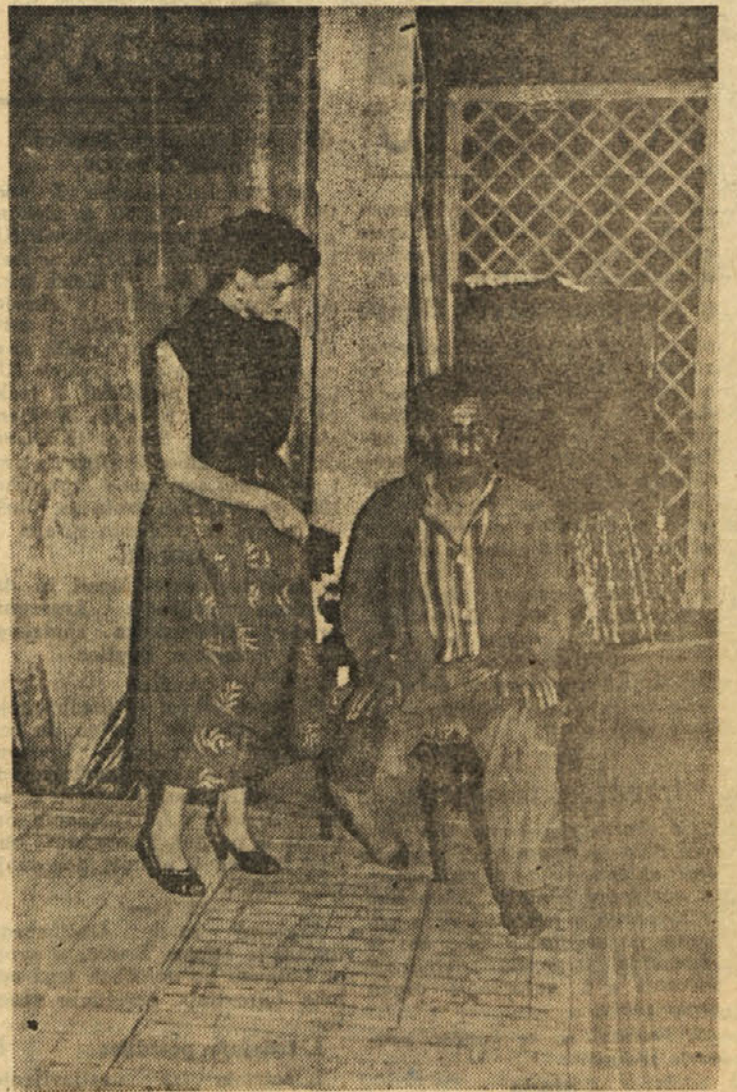
Lisec se bo odločila...