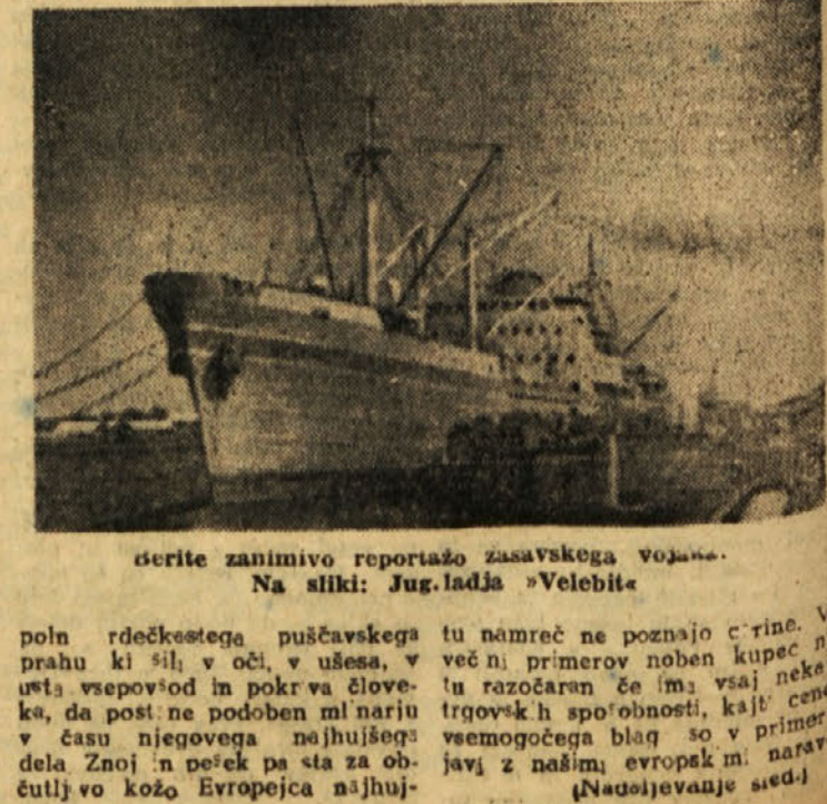
Serite zanimivo reportažo zasavskega vojaka. Na sliki: Jug. ladja »Velebit«

vzhodni obali otoka in se prštev-va za potomce nekdanjih osvajačev. Tudi cerkvene občine Nestorijancev ni več: prebivalci so muslimani, s silo spreobrnjeni v islam v XIX. stoletju, v bistvu pa an misti, ki najbolj časte polno luno. So zelo primitivni, skromni in m. roljubni ljudje, ki žve od dateljnov, kozjega mleka in mesa morskii psov. Toliko sem o tem kosku sveta zvedel od svojega dobrega prijatelja, zdravnika v indijski mornarici Tik pred odhodom v Evropo in je v klubski sobi hotela »TAJ MAHAL« v Bombayju povvedoval o moji skorajšnji pomorski poti, ki je zlasti do Suez dobro poznal: še iz let, ko je kot zdravnik služil v angleški mornarici. Ko smo pustili za seboj Socotra, se je morje pomirilo pomirili pa smo se tudi in na ledji. Drugo jutro smo že bili v svobodni luki Aden. Čeprav smo si želeli vsaj nekaj dni počitka, ki smo si ga po