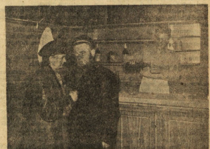
Prizor iz igre „Ana Christie“

In oven je samozavestno odgovoril: »Milostni gospod kralj!