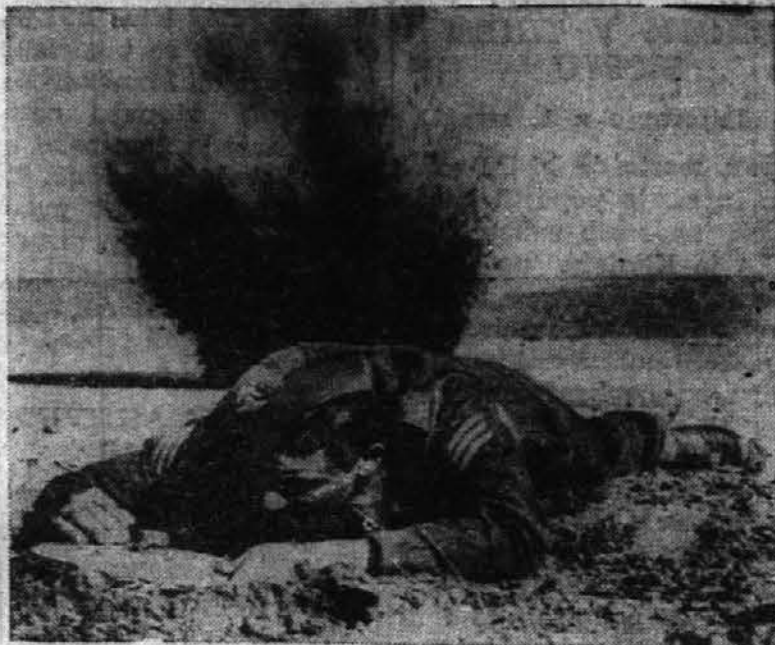
Slika kaže angleškega korporala, ki preiskuje površino, ki jo je sovražnik podminiral. Ne daleč za njim je eksplodirala ena izmed min.