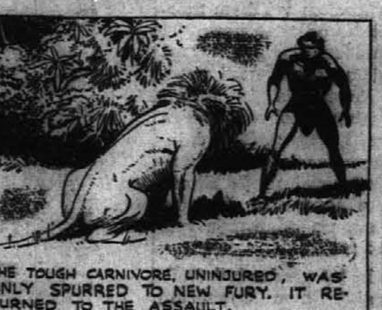
THE TOUGH CARNIVORE, UNINJURED, WAS ONLY SPURRED TO NEW FURY. IT RETURNED TO THE ASSAULT.