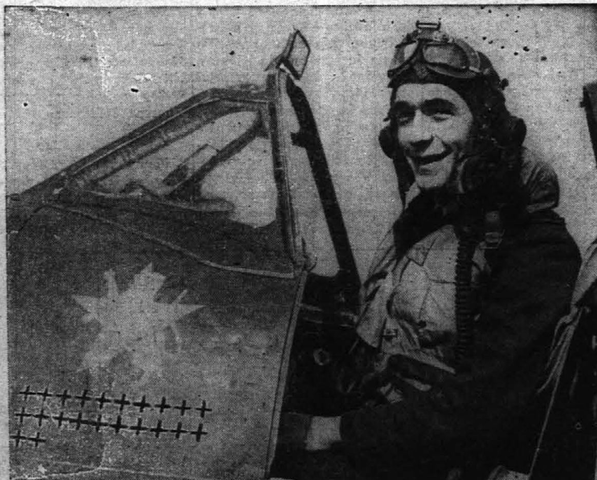
Slika kaže 23 letnega angleškega letalca D. E. Kingaby, ki je s svojim letalom izstrelil v bitkah še 23 sovražnih letal. Za vsako sovražno letalo, ki ga je izstrelil ima narejen križ na strani letala. Star je 23 let in 23 letal je uničil.