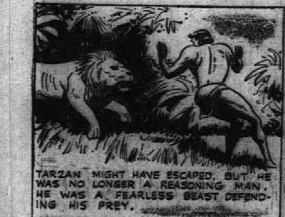
TARZAN MIGHT HAVE ESCAPED, BUT HE WAS NO LONGER A REASONING MAN. HE WAS A FEARLESS BEAST DEFENDING HIS PREY.