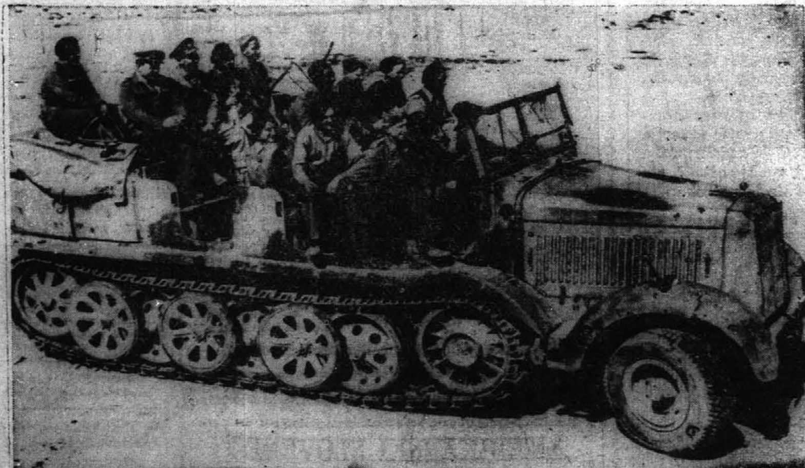
Zavezniki so v zaojtu nemških čet zajeli tudi takomenovani ne mški Mercedes-Benz truk, s kakorinimi so se Nemci vozili po afriških peščenih krajih. Zdaj so z njim vozijo angleški vojaki, ki saste dujejo bežeče Nemce.