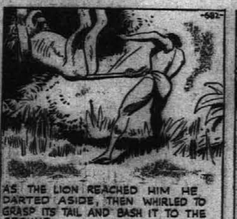
AS THE LION REACHED HIM HE DARTED ASIDE, THEN WHIRLED TO GRASP ITS TAIL AND BASH IT TO THE GROUND.