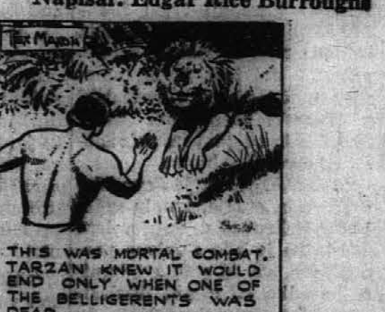
THIS WAS MORTAL COMBAT. TARZAN KNEW IT WOULD END ONLY WHEN ONE OF THE BELLIGERENTS WAS DEAD.

Tarzan bi bil lahko ušel, toda zdaj ni bil nič več preudaren človek. Bil je neustrašna zver, ki brani svoj plen.