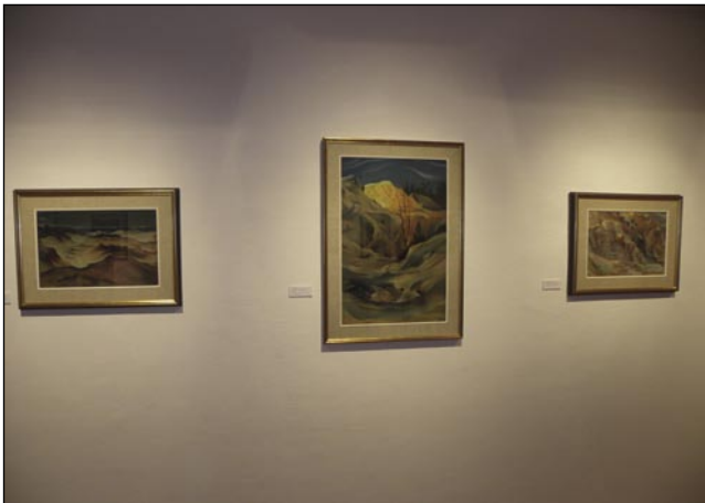
Sipina ob Tihem oceanu na polotoku Monterey v Kaliforniji – 1929; Mamutske terase Yellowstone – 1929 in Yellowstonske terase – 1929

godkih, o naravnih lepotah in posebnostih dežel. Nastali so tudi številni portreti, saj se je med potovanjem preživljal predvsem s portretiranjem slovenskih izseljencev, znanih oseb iz filmskega sveta in premožnejših mogotcev ameriškega gospodarstva. Po-