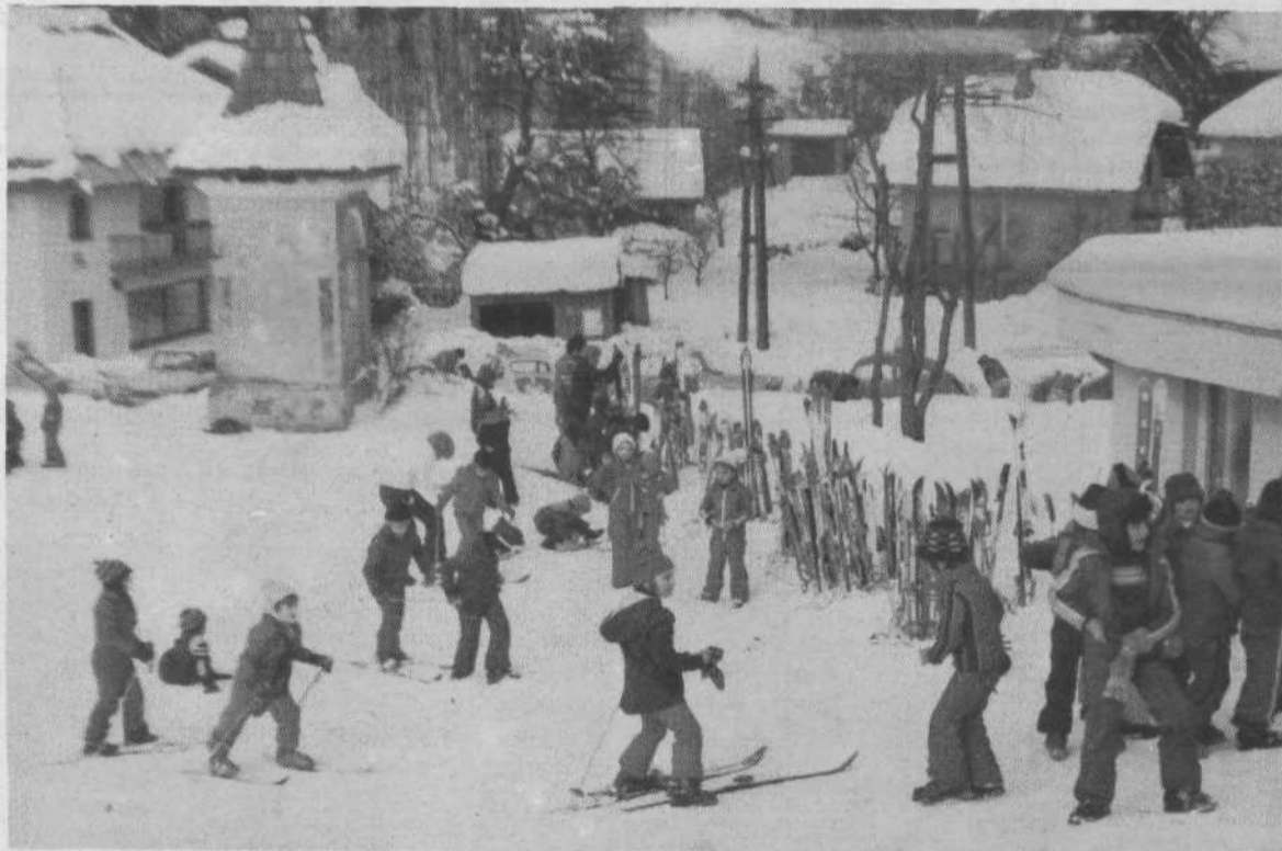
»Tazaresni« del tečaja; prvi koraki s smučmi, ki se tako hitro izmuznejo izpod nog