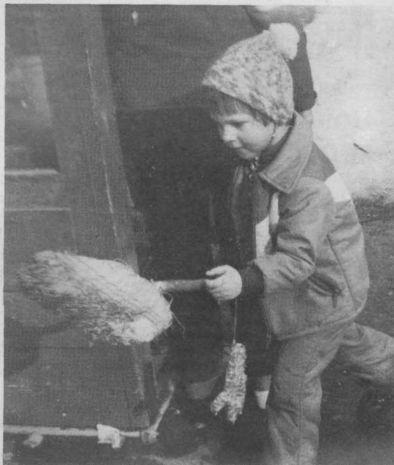
Mali mož z veliko metlo... kaj si more, sneg je pač treba spraviti z oblačil