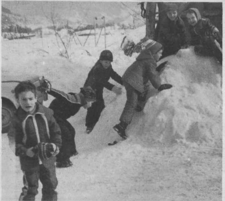
Snega jim ni bilo nikoli zadosti – tudi kepanje je navsezadnje zimski šport