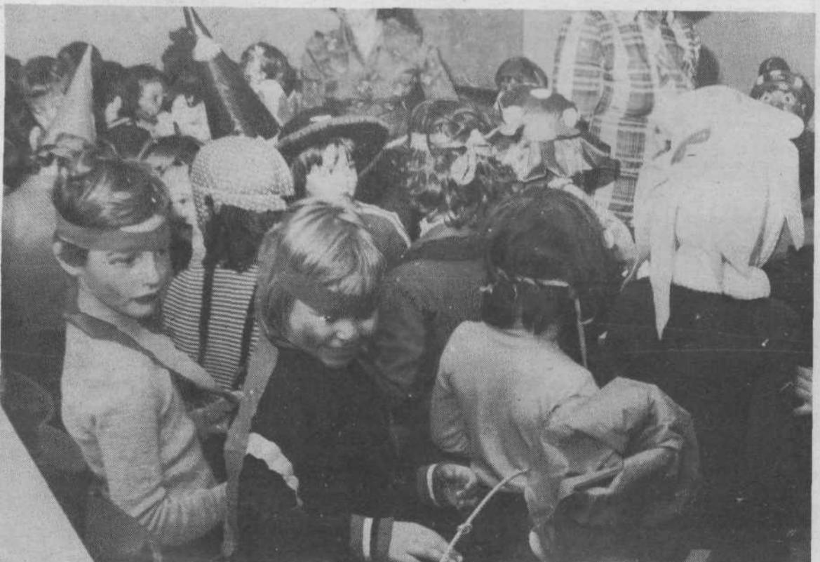
Skupina, ki smo jo obiskali, je imela še posebno srečo; v Gorjah so bili prav v času pustovanja, kar so seveda z velikim veseljem izkoristili