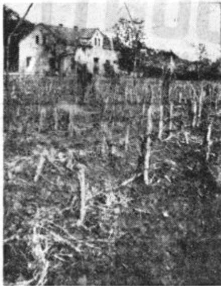
Opustošeni vinogradi okrog Bizeljskega

V nedeljo 3. julija popoldne je prihrumel vihar, da je ruvalo drevesa, podiralo svinjake in