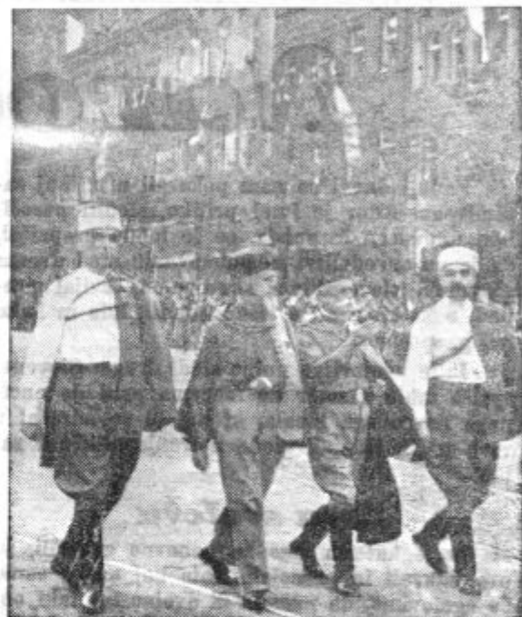
Starešine v Slovanski sokolski zvezi včlanjenih sokolskih organizacij v slavnostnem sprevedu v Pragi