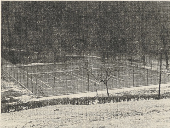
Igrišči za tenis — prvenec rekreacijskih objektov v našem športnem parku

K temu še dodajmo izgradnjo 15 m visokega stolpa na Janini, ki ga bo dogradilo tukajšnje Turistično društvo. Postavljen bo na mestu, kjer je že svoj čas stal leseni stolp. Pokrit plavalni bazen ob novem hotelu in dvostezno kegljišče v njem bo izbiro za aktivnost še mnogo povečalo. Smučišče z vlečnico na Janini ni utopija. Strokovnjaki trde, da so tereni več kot idealni. Uredili bomo še nekaj standardnih poti za hojo do določenega cilja. Smeri bi najšle na Janino, Tržaški hrib, Cvetlični hrib, na Bellevue in še kam. Označene bodo z