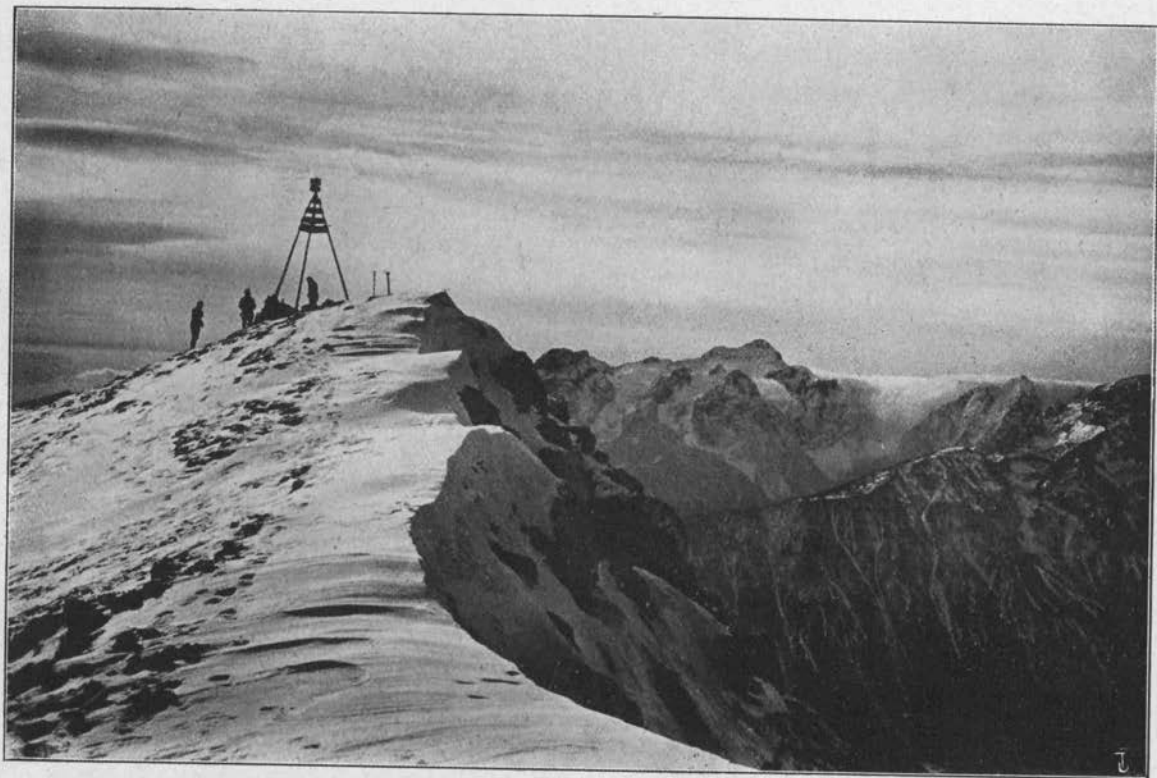
Pogled s Kepe (2144 m) na Triglavsko skupino