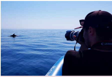
Fotografiranje hrbtnih plavuti delfinov za individualno identifikacijo.

ekotipa velike pliskavke, ki so ga spremljali s pomočjo satelitskega oddajnika po daljši rehabilitaciji v ujetništvu.