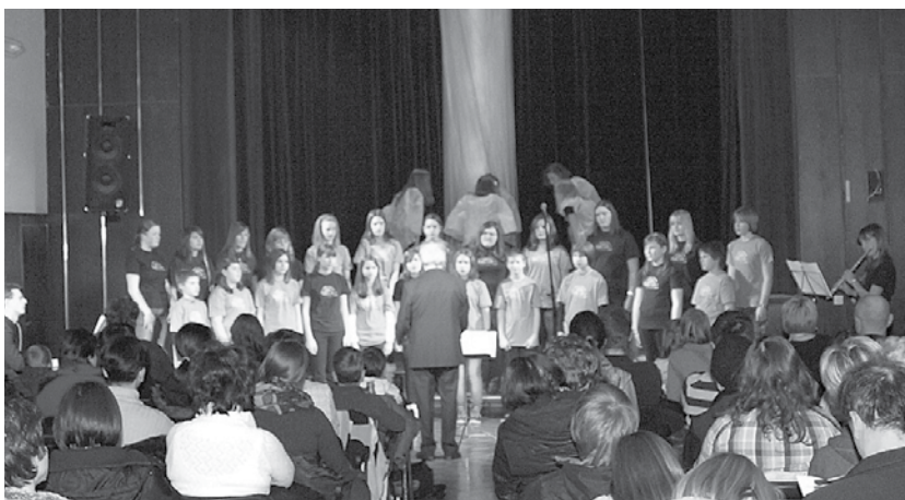
Pevci mladinskega zbora OS Tabor so spet navdušili.