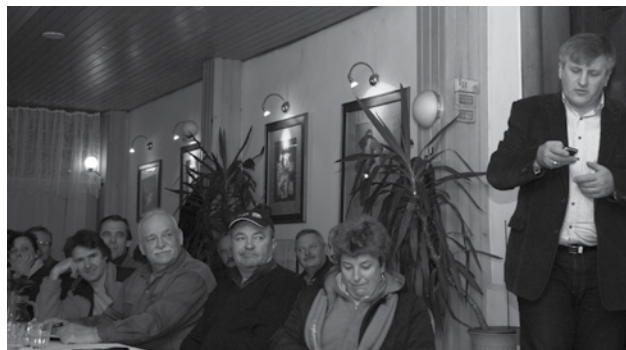
Zanimanje za izobraževanje je med čebelarji veliko, predavanja se je udeležilo več kot 40 čebelarjev.