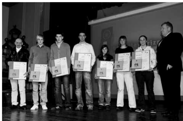
Najboljši logaški športniki preteklega leta (nekateri priznanj niso prevzeli lastnoročno).

in 900 krogov, v disciplinah indoor 18 metrov in gozdni krog pa je dosegel zmagovalno stopničko. V skupnem seštevku v