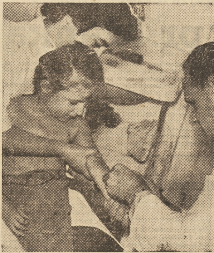
Te dni vodijo starši svoje otroke že k drugemu cepljenju proti otroški paralizii. Zanimanje staršev za cepljenje je veliko. To je razumljivo. Nič več ni nevarnosti, da bi njihov otroček zbolel za otroško paralizii.