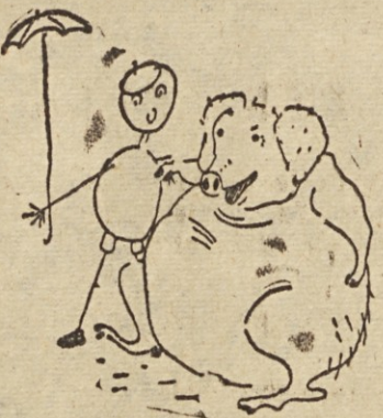
Ilustracija h knjigi Čarobna kreda, kjer oživi vse, kar nariše dečkova čarobna kreda

Torej, otroku v roko mladinsko knjigo? Svet mladinske književnosti je izredno širok in dokaj mlad, šele v zadnjem sto-