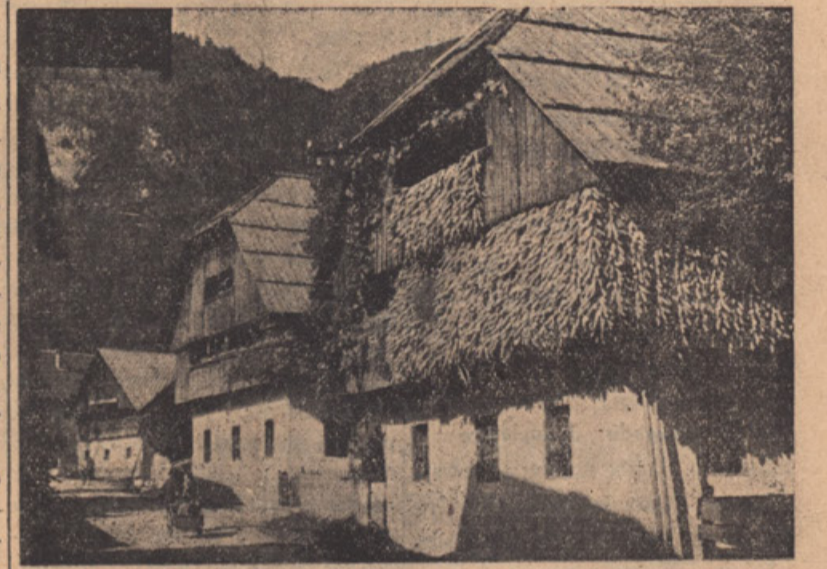
FARMERS HOME — HARVEST IN SLOVENIA

The Bishop Baraga, who had come to America in 1831, published a grammar and dictionary of the language of the Chippewa Indians. In the same language he also issued later a translation of the Bible and compiled a book of prayers in the language of the Ottawa Indians. As a monument to this man stands the town of Baraga in Michigan. In Minnesota Kaintown was originally founded a hundred and fifty years ago by a group of immigrants coming from the province of Krain in their own country. The second generation of farmers now live prosperous, they are the bulwark of the Country. (From Konrad Bercovici, On New Shores. The Century Co., New York, 1925, pp. 148, 149).