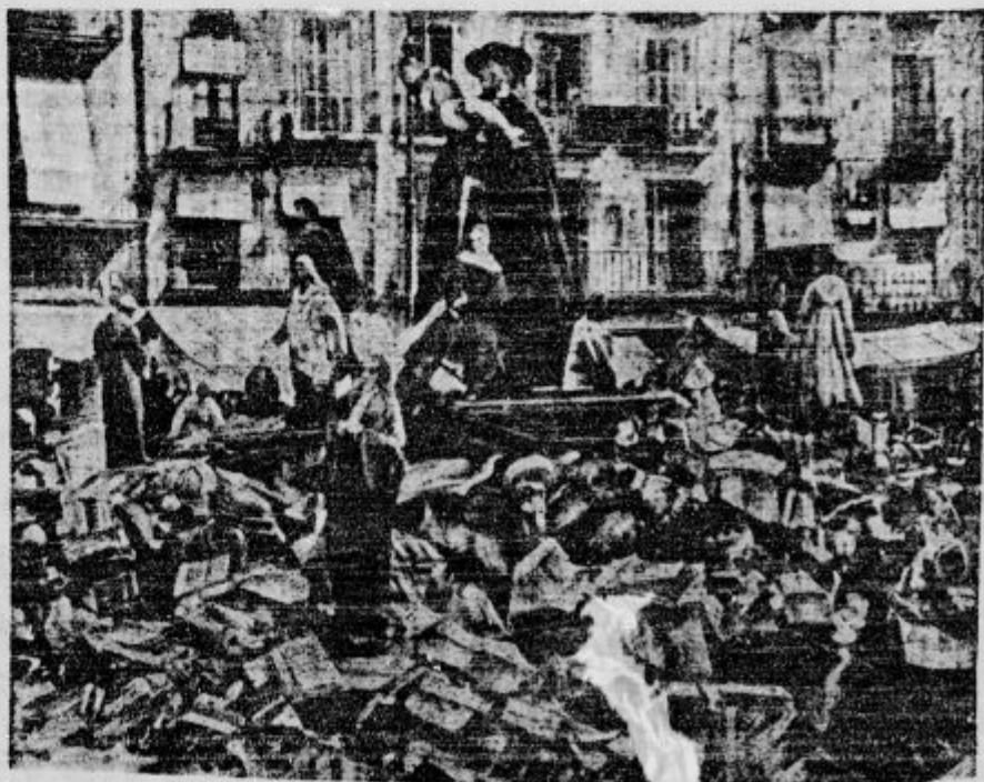
Španski komunisti uničujejo kipe svetnikov in cerkvene zaklade.