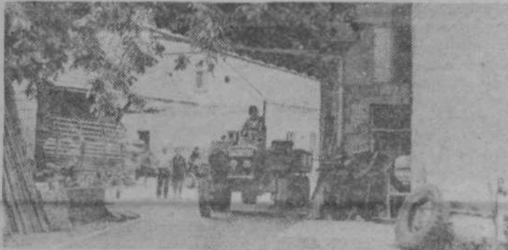
Lepo urejeno asfaltirano dvorišče in dva velika silosa pri Hrvatovih.