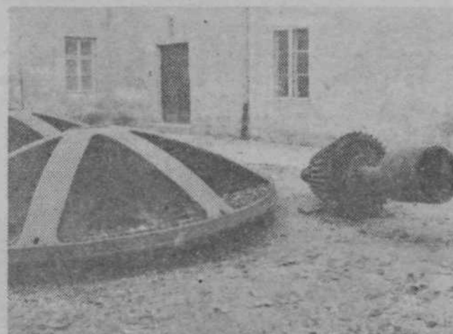
Multiplikator dotrajane Andričove turbine vevške elektrarne na Ljubljani je imel vgrajene še lesene zobe. Na dvorišču fuzinskega gradu čaka na prevoz v tehnični muzej.