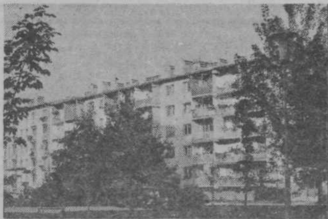
Ze legajo sence