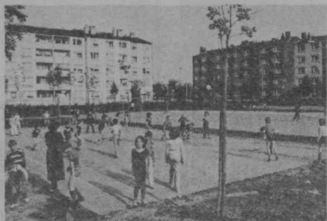
Živ-zav na igrišču OŠ Karla Destovnika-Kajuha