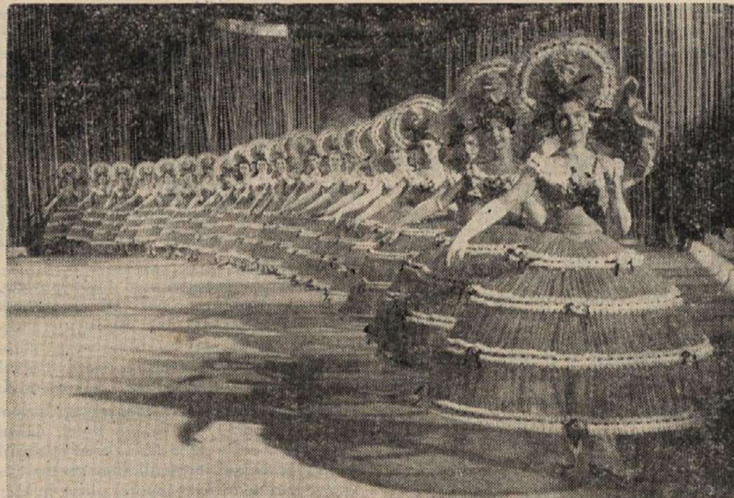
Veliki valček „Dunajske revije na ledu“.

Pa za danes zadosti. Zaradi velikega navala, ki ga pričakujejo, svetujemo, da si karte nabavite že v predprodaji.