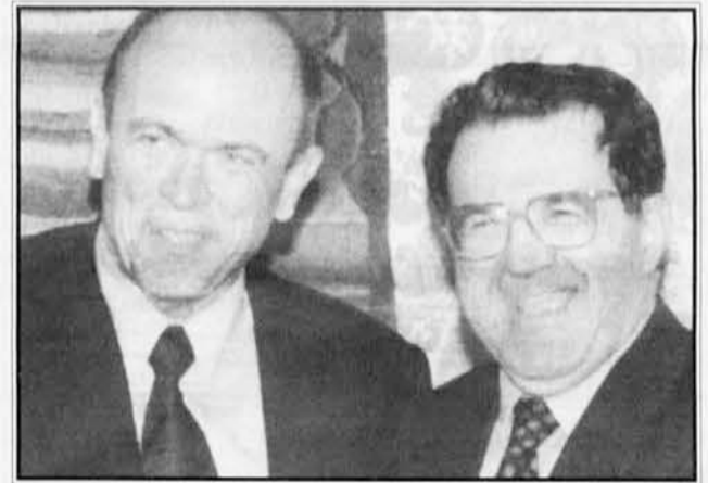
Predsednika nasmejanih obrazov

Osimu je marsikateri naš rojak mislil, da bo država, v kateri živimo, s "posebnimi normami", kot dobesedno določa 6. člen republiške ustave, zaščitila našo manjšino in da bo hkrati izpolnila mednarodno sprejete obveze. Pa se je ta naš rojak, žal, bridko motil.