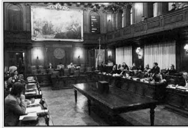
Slovenščina še vedno buri duhove v tržaškem občinskem svetu

Razprava o rabi slovenske jezika v tržaškem občinskem svetu se še ni končala. V četrtek, 20. junija (torej na dan izida našega časopisa), je predvideno glasovanje o sprejetju pravilnika občinskega sveta.