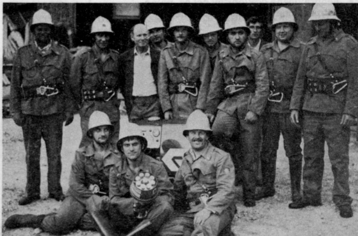
Industrijsko gasilsko društvo LIP Bled, TO Mojstrana je bilo ustanovljeno 1981. leta.

Letos je minilo 5 let, odkar je bilo v Mojstrani ustanovljeno