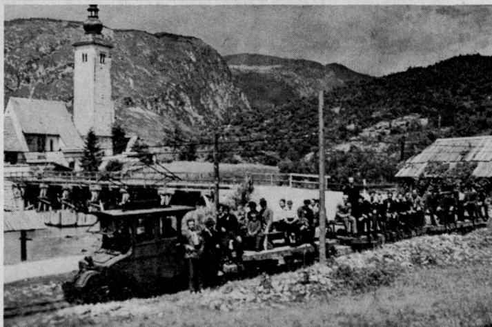
Električni vojaški vlak iz prve svetovne vojne pri Sv. Janezu v Bohinju

Studor, vas v zgornji bohinjski dolini, je tipično kmečko naselje z izvirnimi kmečkimi hišami. Za domove so značilne velike strehe, »ganki«, okrašeni z gorenjskimi nageljni. Zaradi izvirne arhitekture je vas zaščiten in tako ni mogoče zgraditi kaj novega. Zanimiva je hiša št. 14 zaradi lesenega nadstropja z rezljanim gankom, dalje št. 16 vsebuje bogato notranjo arhitekturo in črno kuhinjo. V hiši