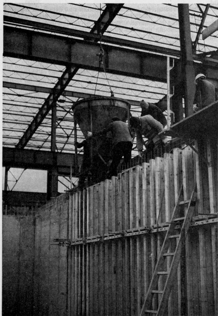
Jeklarna 2 na Jesenicah je trenutno eno največjih gradbišč pri nas. Čeprav je osnovna konstrukcija proizvodne hale jeklana, so močno zastopana tudi betonska oz. armiranobetonska dela. V ta dela smo vključili tudi naš opaž za steno LG 100.