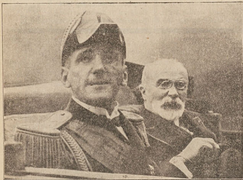
Poslednji snimak Blaženopočivšeg Kralja Aleksandra.