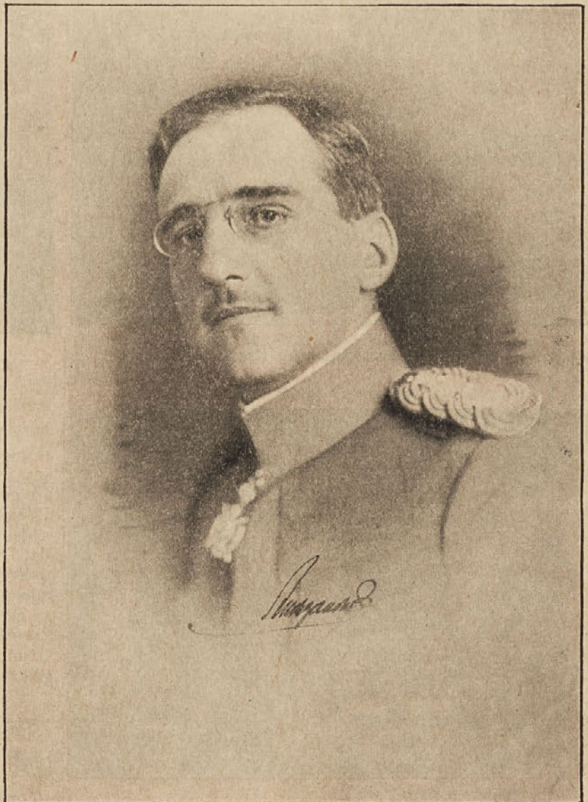
Blaženopočivši Kralj Aleksandar I

Jugoslovanski narod plaka ob bridki zgubi svojega najdražjega, plaka in pretaka solze odkritosrčne in globoke žalosti, ker je svojega Vzvišenega Vladarja Viteškega Kralja Zedinitelja ljubil z res odkrito in vdano ljubeznijo. Plaka, ker se zaveda, da je v njegovi osebi zgubil očtvojskega voditelja heroja, kakor že dolgo ni vladal v vsej Evropi.