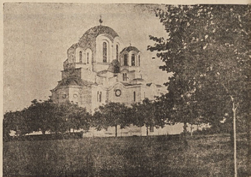
OPLENAC. — Zadužbina Blaženopočivšeg Kralja u kojoj je sahranjen.