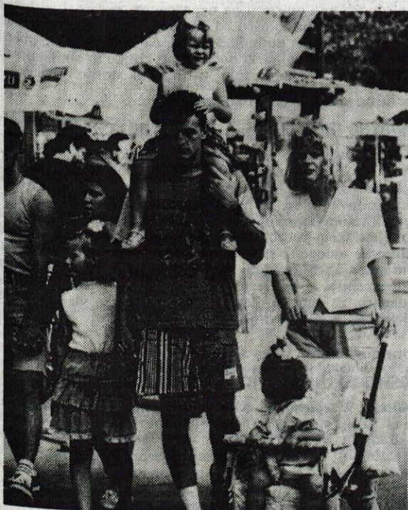
Na Bled brez prometnih zamaškov?

Blejska obvoznica je v osemdesetih letih "padla" na ustavnem sodišču, veliki prometni problemi, s katerimi se kraj ubada vsako turistično sezono, pa so ostali. Občina jih zdaj spet poskuša reševati. V kratkem se bo začela javna razprava o razbremenilnih cestah proti Bohinju in Pokljuki.