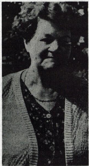
hiši, ko je bil star pet let. Do tedaj je bil v zavodu v Kamni Gorici, od koder sem ga spočetka jemala k sebi le na počitnice. Potem pa je ob...