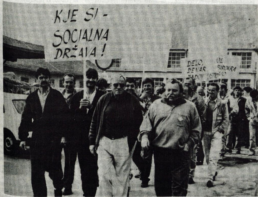
Včeraj dopoldne so Zlitovi delavci protestno zapustili tovarno.

V četrtek dopoldne protest v Trziču, v petek pa pred kranjsko podružnico SDK.