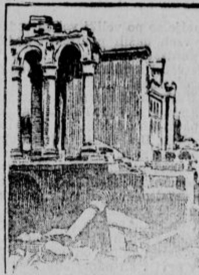
Stare rimske razvaline v Ghirs (Tripolis).