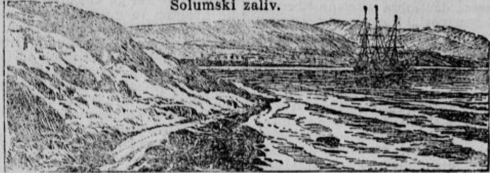
SLIKE IZ TRIPOLISA.

Ostrožnika. Oba se bosta zagovarjala pred sodiščem.