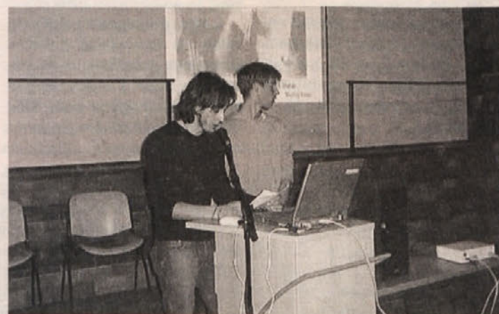
Dijaki Dvojezične trgovske akademije pri predstavitvi projekta

upoštevali z utemeljitvijo, da gre za prihodnost šolarjev in naj bi se o tej pozanimali osebno in ne le po računalniku. Ena od novosti je tudi film o TAK, ki si ga lahko presnamete (downloaden), kar pa traja razmeroma dolgo.