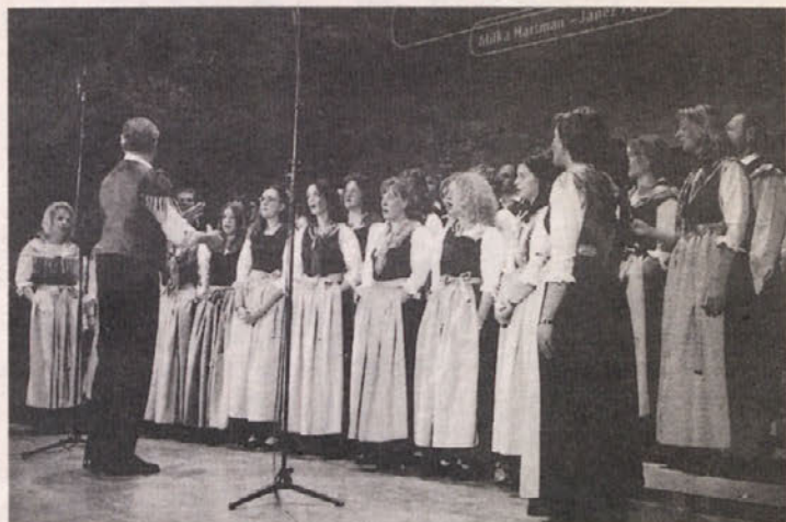
Radiški mešani pevski zbor