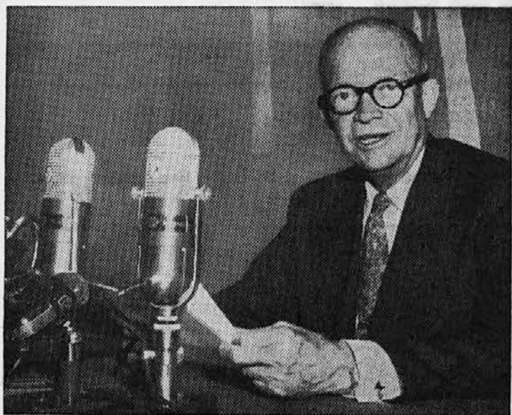
DWIGHT D. EISENHOWER