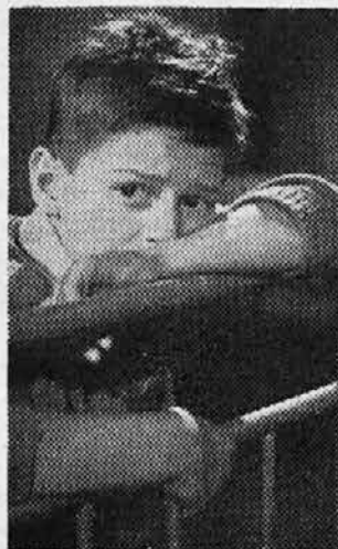
TUGO STIGLIC v vlogi Marka

realnost življenja ter pisali zanj umetniško visokovredne scenarije. Dali bi mu lahko široko ozorje in ga usmerili v pravo življenjsko in slovensko problematiko, da bi se ne lovil okrog plehkkih komedij in za lase privlečenih problemov. Seveda pa bi morali dati filmskemu ustvarjanju več prostosti v izbiri scenarijev in motivov, ne pa ga smatrati samo za nekako propagandno ustanovo.