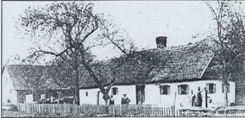
Rojstna hiša Janeza Puha v Sakušaku pri Juršincih. Original last družine Zidarič, Sakušak pri Juršincih