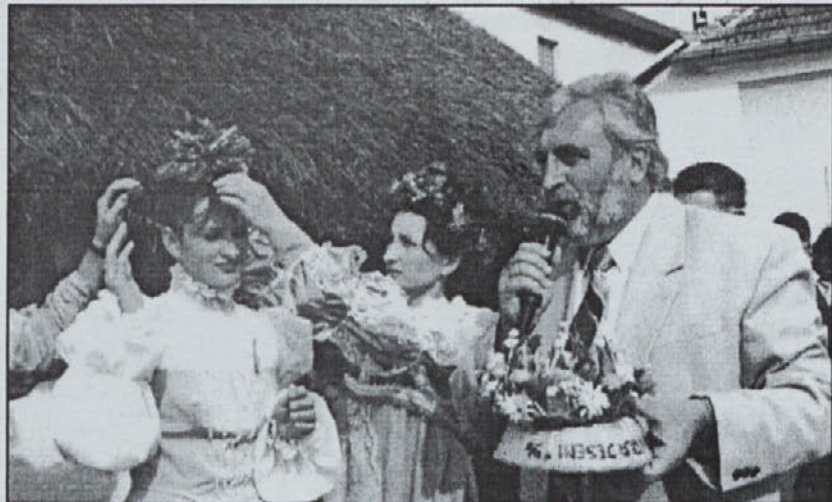
Izvolitev občinske kraljice