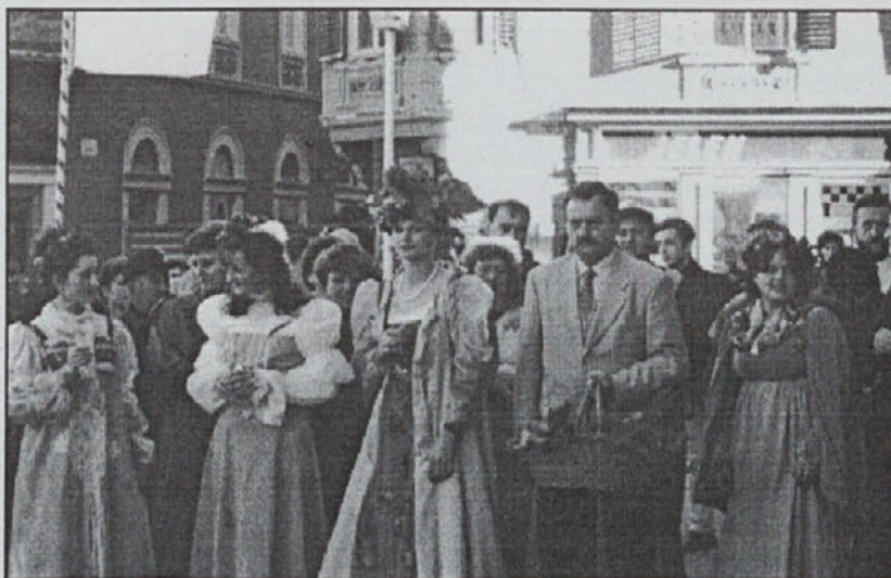
Kraljice pri ptujskem županu

Zadovoljstvo je bilo še toliko večje, ker nas je obiskalo veliko ljudi od drugod, posebej iz Ptuja, kamor so se naše kraljice že nekaj dni prej