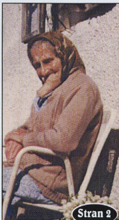
ŽARNICA ZASVETILA V TREH GOSPODINJSTVIH