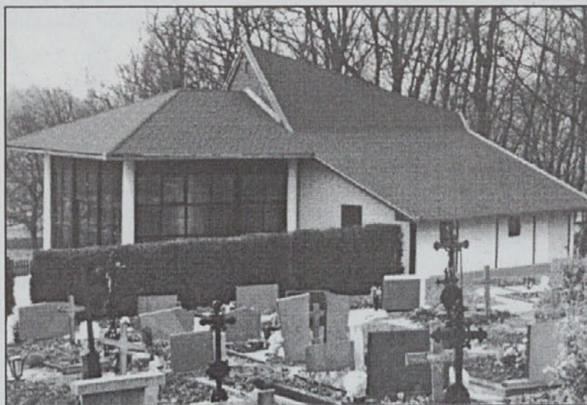
Prenovljena mrliška vežica