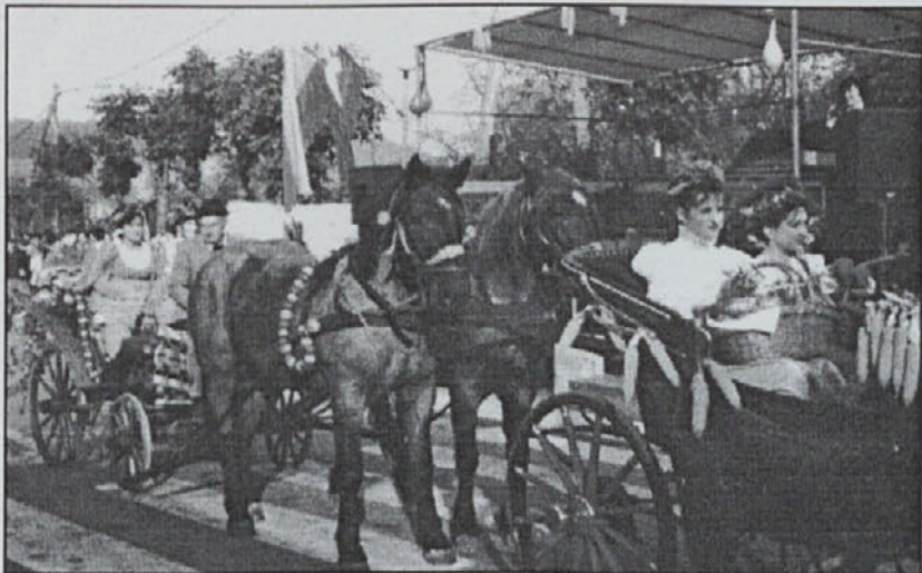
Tako so se pripeljale kraljice

Letošnje 1. mesto v občini sta si razdelila dva doma (v Juršincih in