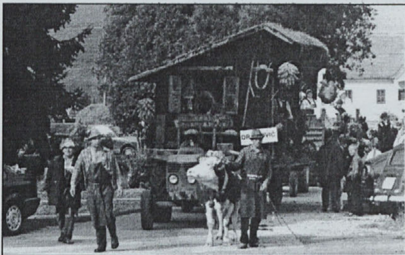
Tako so predstavili Dragovičani svoj hlev

pridemo do mleka: od travice, krme - kopice, do dela z živalmi v hlevu - molže - pa do mleka in končnih izdelkov - skute, sirnih namazov, sirov, do znanih prleških gibanc.