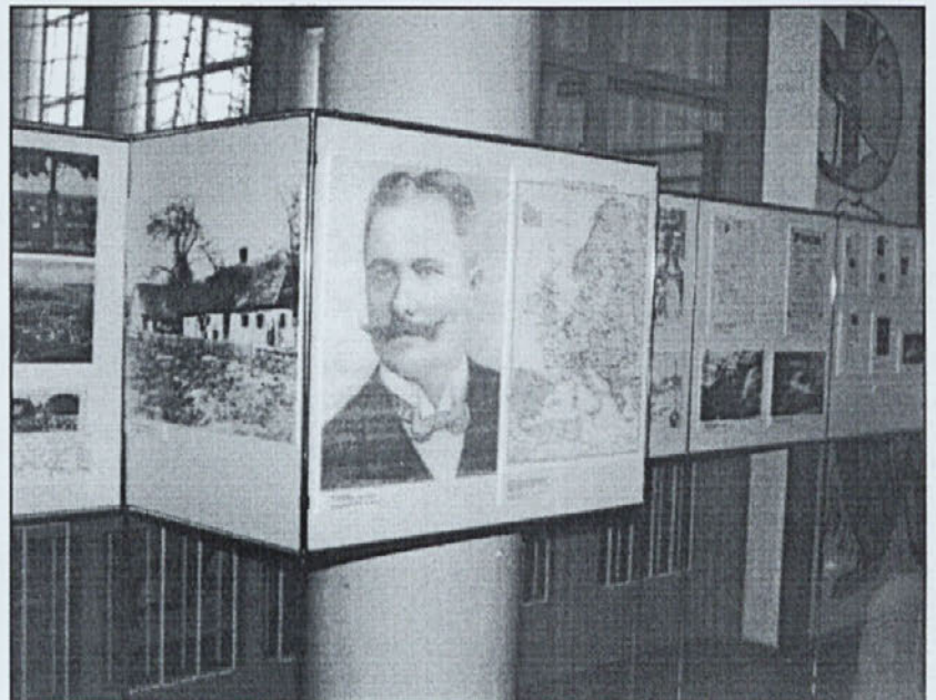
Utrinek iz napovedne razstave o Janezu Puhu v OŠ Juršinci