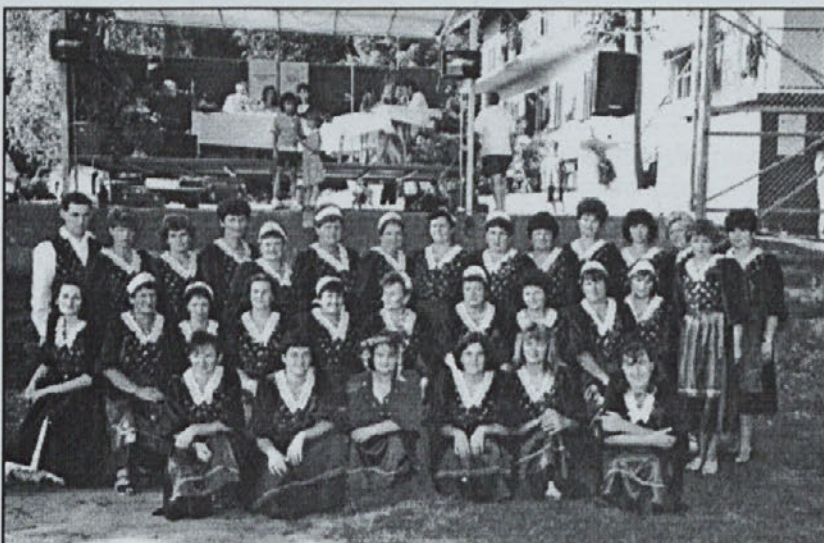
Gospodinje ob drugem gospodinjstvenem prazniku

Na gospodinjstvenem prazniku (na okrogli mizi) je bilo govora o zdravi prehrani, o osnovi kuharstva in kuharstvu nasploh. Zelo bogato razstavo sadnih dobrot je odprla kraljica sadja. Delček razstave smo posvetili tudi našim ročnim delom in razstavi različnih kuharskih knjig. Tudi kulturni program, na katerega smo se pripravile same (z igrico), se je navezoval na sadne dobrote. S tem praznikom smo povzdignile naše