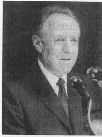
Carlo Azeglio Ciampi novi mandatar za sestavo italijanske vlade. Prvi mandatar, ki ni član parlamenta. Po 92. členu ustave je predsednik republike avtonomno zbral premiera, ta pa bo prav tako avtonomno zbral ministre.