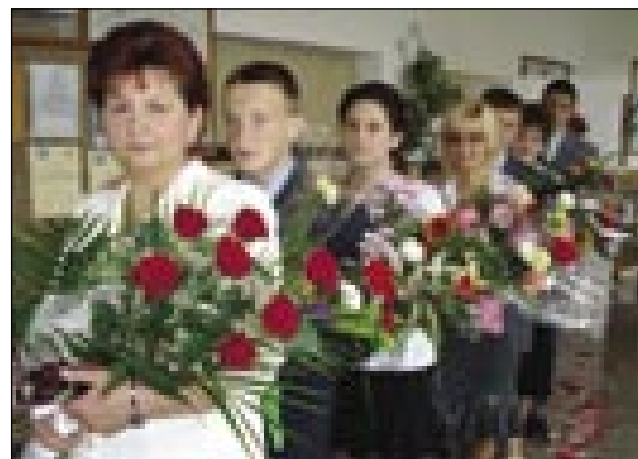
Letos se je na gornjesenički šoli poslovilo 6 osmošolcev