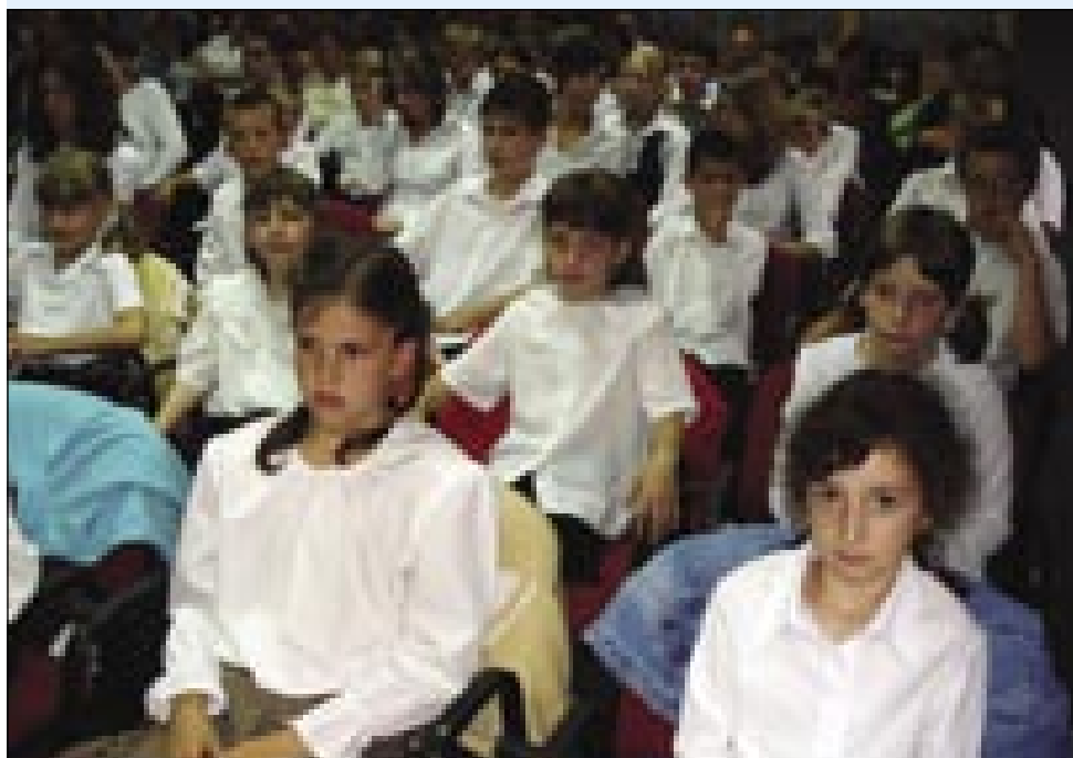
V dvorani Slovenskega doma se je zbralo kakšnih 150 učencev in dijakov ter njihovih učiteljev

mlajšov iz obadvej dvojezični šaul (Gorenji Senik, Števanovci) iz varaške osnovne šaule, iz gimnazije pa srednje strokovne šaule Bela III.