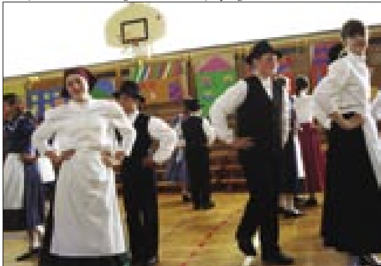
Otroška folklorna skupina ZS z Gornjega Senika v Mariboru

je potekal 29. maja v Mariboru, v telovadnici osnovne šole Borisa Kidriča. Ob dveh smo se