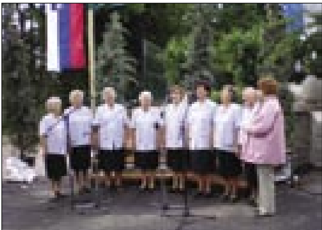
Monoštrske ljudske pevke v Volčjem Potoku

domačih udeležencev. Predstavile so se skupine iz Slovenije, Madžarske, Hrvaške in Italije, med njimi otroški, mešani, ženski in moški pevski zbori, ljudski pevci in pevke ter folklorna skupina. Ta slika je dobro ogledalo, kako pester program so lahko