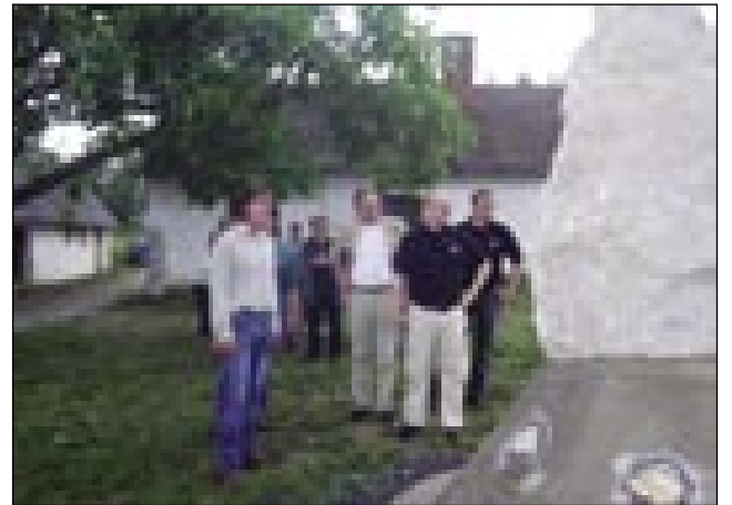
Zmago Jelinčič pri »Malom Triglavu«

7. junija, v soboto, je prišlo na kratek obisk k nam predsednik stranke SNS (Slovenska nacionalna stranka), gospod Zmago Jelinčič. Večer na šesto vöro smo bili zgučani pri »Malom Triglavu«, kama smo vse Andovčane pozvali. Cejli den se je dež lejvo, dapa kak če bi zgučano bilau, na šesto vöro, gda je predsednik prišo, se je sonce vöpokazalo. Prva paut je predsednika h kamni pelala. Tam se njemi malo tapravo, kak smo prišli do té ideje, ka se gorpostavi te kamen tū v Andovci kak simbol slovenstva. Potejm sam na kratki notrapokazo ves pa našo društvo. Predsednik je tapravo, ka je že večkrat biu v Porabji, dapa na taumtali zdaj prvič. Sploj se ma vidi pokrajina, najbola pa ta ideja,