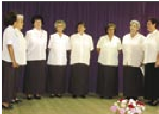
Števanovske pevke v kulturnom programu

ves dosta lidi pride iz Porabja pa cejluga rosaga, gda na priliko vleti pavarska dela