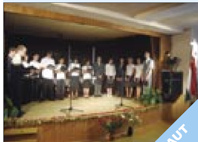
Program ob slovesu so pripravili sedmošolci