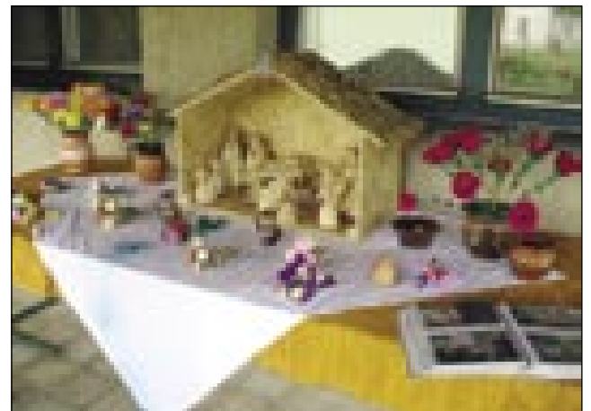
Ka vse delajo na zimski večeraj

v tom, v šteroj porabskoj vesi se ženske najbolje brsajo. Štiri ekipe so bile, gvinila je števanovska. Istina, ka v andovskoj ekipi so same takše dekile bile, štere gnes več ne živijo v vesi. Hapsauk, ka so se dobro brsale, če so rejsan do čonte mokre gratale.