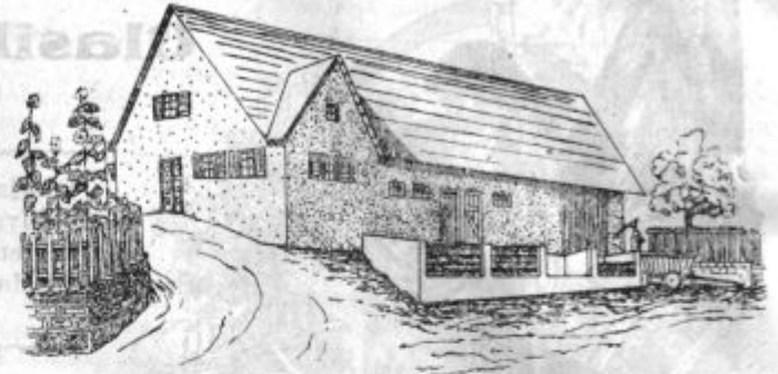
Pod. 1. Virtemberško gnojišče. Lega gnojišča pred hlevom.

polna, se začne polniti druga in potem po vrsti tretja in četrta. Na ta način dobivamo za gnojenje enakomerno predelan gnoj, ki je po svoji sestavi in zrelosti enake vrednosti, ne pa tako različen, goden, napol surov in čisto surov, kakor ga trosimo po naših njivah in iz naših gnojnih kupov. Pri Virtemberškem gnojišču se jemlje gnoj iz polnih jam, kjer je že dozorel in je goden za rabo.