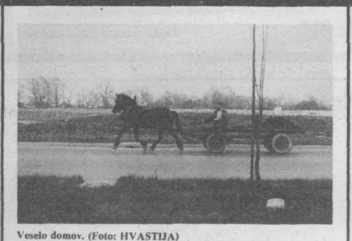
Veselo domov.