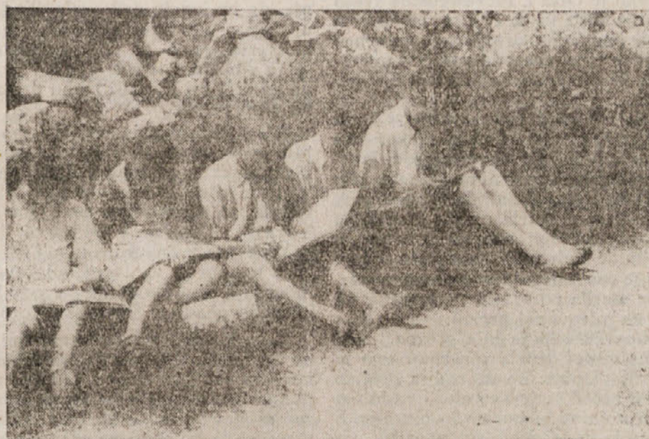
Mladina v delovnih brigadah se tudi pridno uči —

vestnemu nagonu do uveljavljanja in potrebi po kulturnem življenju, ki se je sicer tudi še ne zavedajo, pomeni pa važno silo, ki daje poleta otrokovi mladosti, mu razširja obzorje, uglaja nastop in ga uvaja v mišljenje in delo zrelih ljudi. Naša dolžnost je, da potolažimo ter vedno iznova vzbuj-