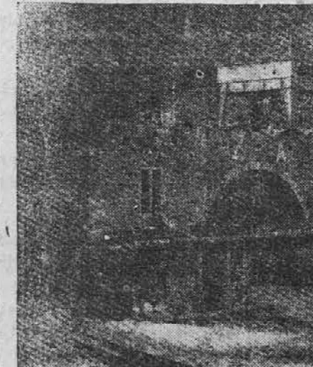
"Vse za petletko" je zapisalo delavstvo ob zaključku glavnih gradbenih del na hidrocentralo Mariborski otok