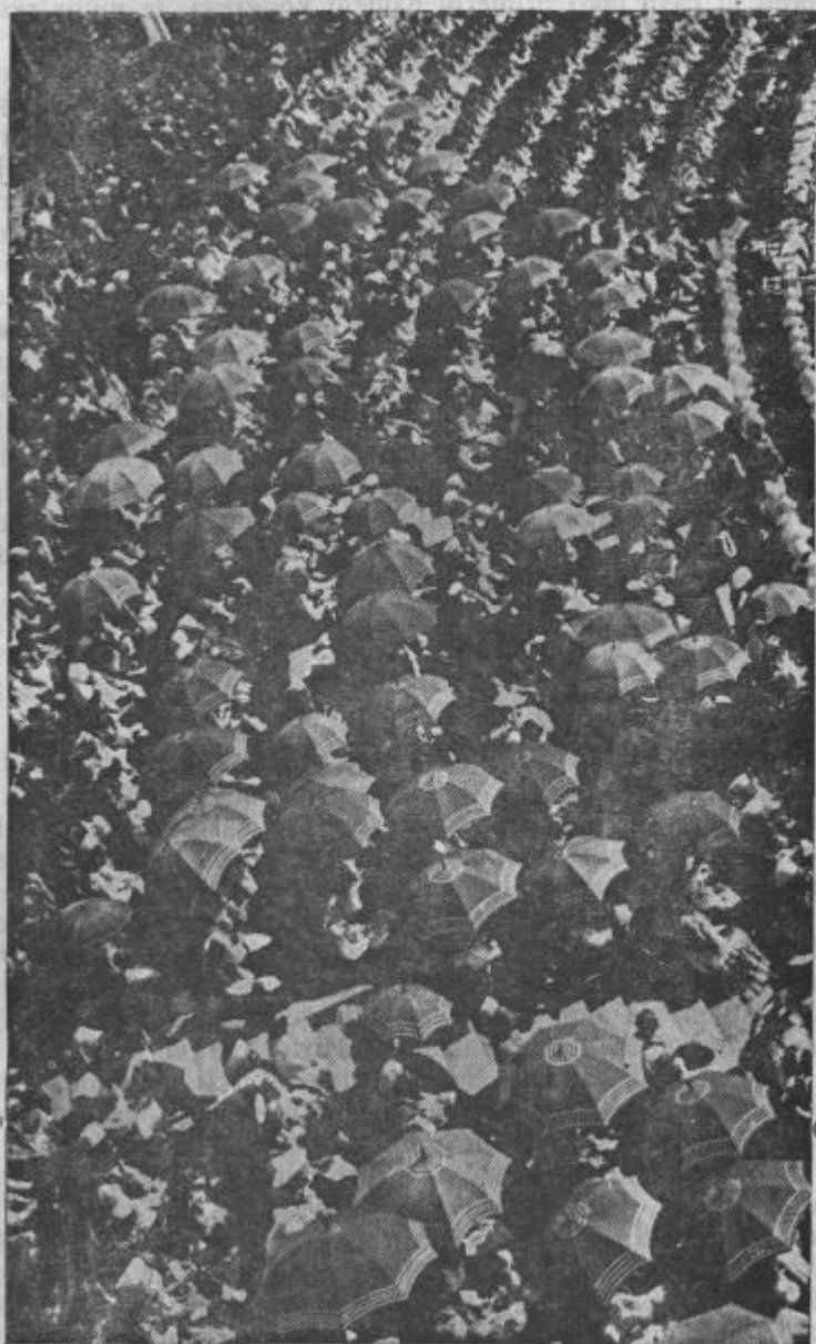
Z Kongresa Kristuša Krala v Ljubljani: Vnožina narodni noš med sv. mešov na stadijanski tribünaj.

in privede do zmagovitih uspehov delo, s katerim naj bi se narodi odvrnili od brezboštva in odpada od Kristusa ter se vrnili k razodeti resnici od poganstva, ki se nanovo poraja, k popolnemu krščanstvu; od materializma in laicizma k življenju