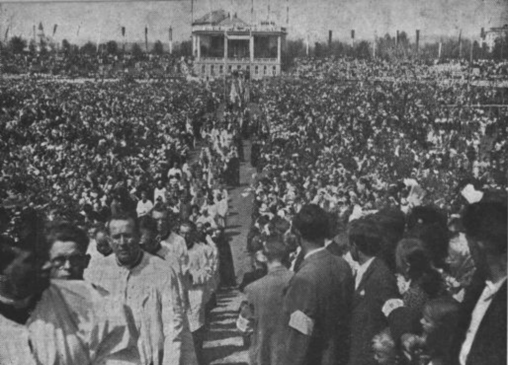
Z kongresa K. K. v Ljubljani: Skofje in ndličniki med mladinskov prireditvijov na Stadioni.

daljumo s prepородom kršćanskega življenja, da naj po tako obnovljenem kršćanstvu prerodimo svet in s tem rešimo za bodoče rodove neizčrpjive zaklade kraljeve dedišćine Jezusove.