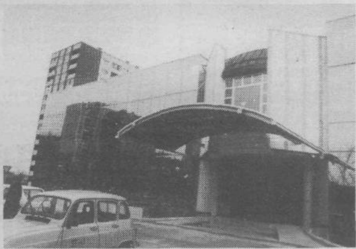
Tako je videti ta hip prav gotovo najbolj nenavadno poslopije v naši občini