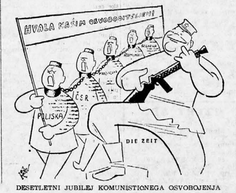
DESETLETNI JUBILEJ KOMUNISTIČNEGA OSVOBOJENJA

Tako prihaja »Pravda« v svet, skovana od štiri in sto urednikov, zaštrana od nekaj sto inštruktorjev, vodena in cenzurirana od CK KP. Od vseh teh njenih fabrikantov pa se verjetno nihče več ne zaveda smisla njenega naslova: »Pravda« pomeni »Resnica«.