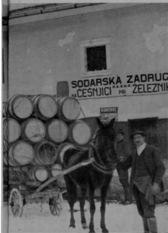
riči pri Železnikih.