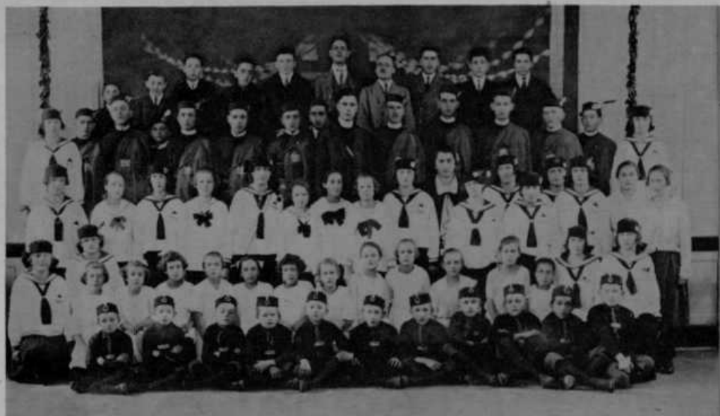
Orlovska družina v Slovenski Bistrici ob priliki telovadne akademije dne 19. dec. 1926.