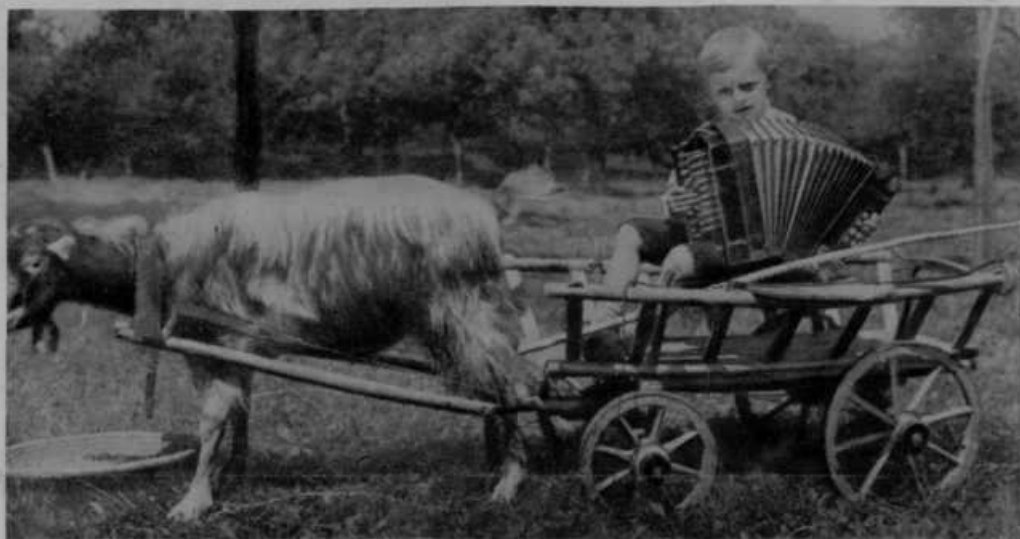
Petletni Zidaričev Pepček v Rušah v svoji gala-kočiji.