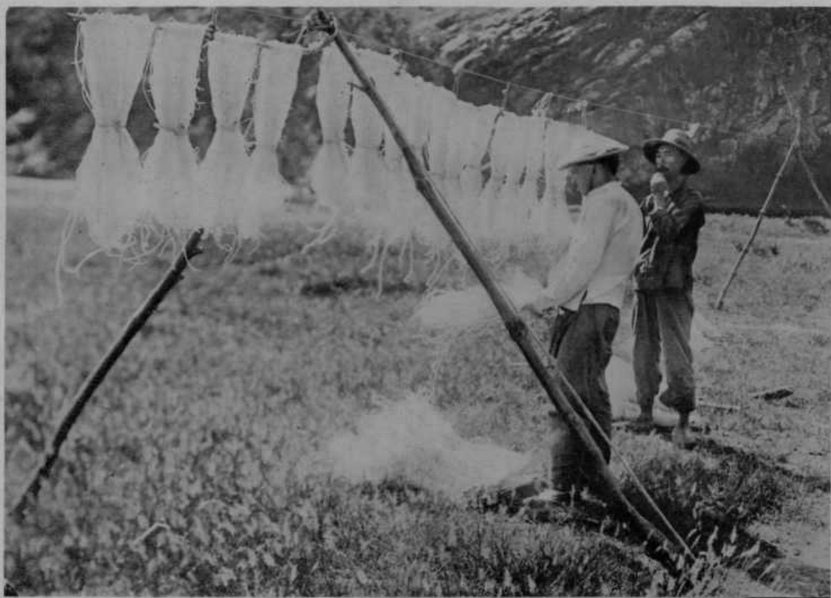
Kitajci imajo poseben način, kako si pripravijo okusne rezance (nudle). Iz krompirja naredo neke vrste moko, to skuhamo, razvlečemo v testo, napravijo rezance, ki jih v debelih povsemih posuše na prostem.