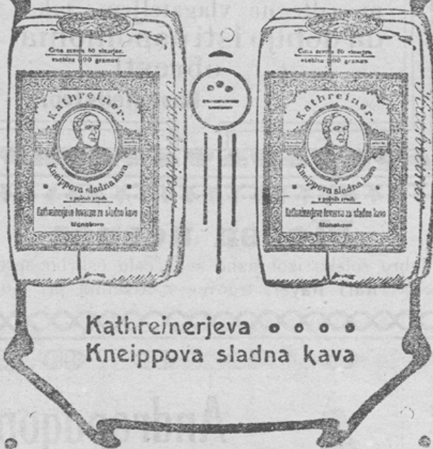
Kathreinerjeva • • • • Kneippova sladna kava

Samo v teh zavojih se dobiva pristna, tako splošna priljubljena