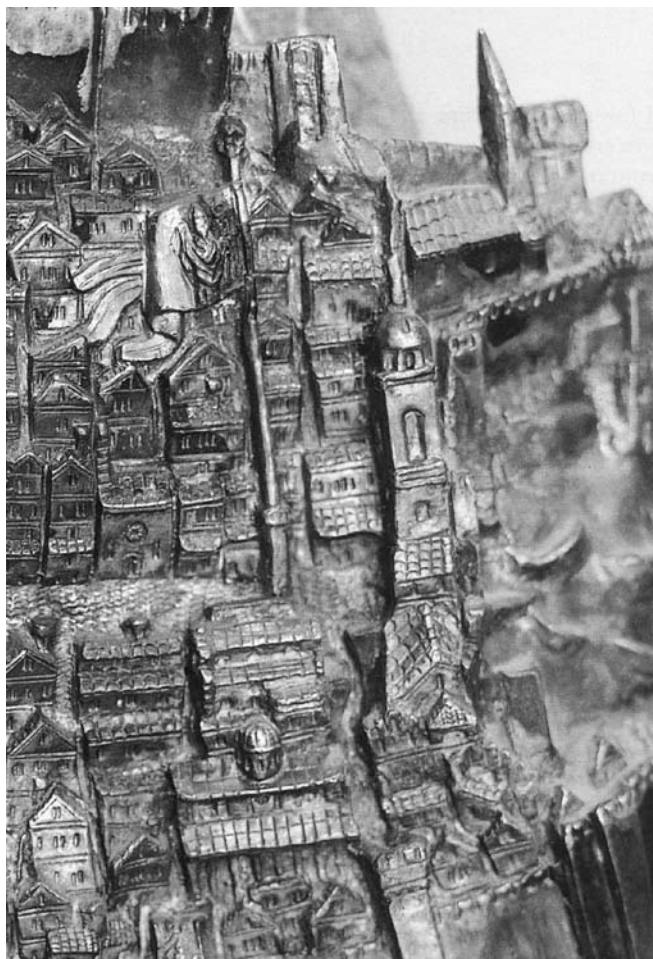
1. Sv. Blaž (detajl s cerkvama sv. Vlaha in sv. Marije), sredina 15. stoletja. Dubrovnik, c. sv. Vlaha

Prvi znani dokument o gradnji cerkve mestnega zaščitnika na današnjem mestu je pogodba s kamnosekom Grubojem Berkovim, da bo v korčulskem kamnolomu Solinu pripravil 5000 kamnov za cerkev sv. Vlaha, datirana 21. februarja 1348. Šele 26. februarja je veliki svet sklenil, da se bo gradila cerkev na Placi, in približno določil mere cerkve. 30 Gradnja je potekala v času največje epidemije kuge, ki je hudo prizadela