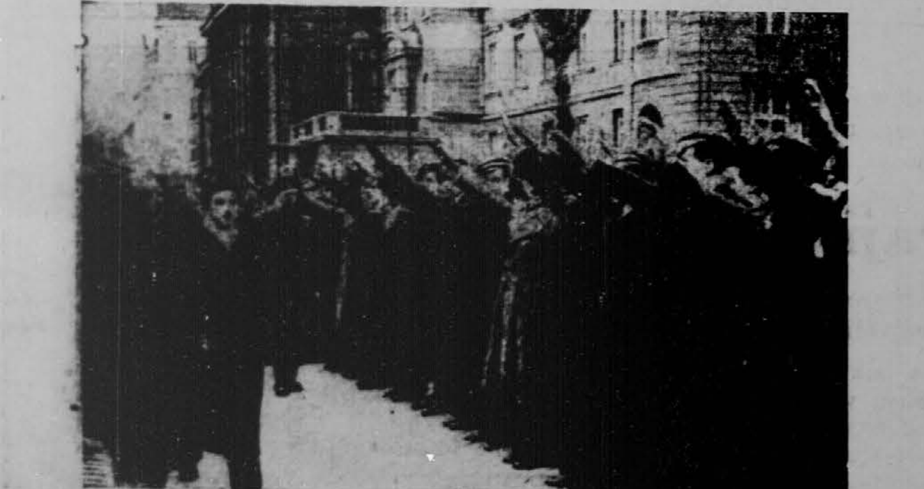
Ko je bolgarski kralj Boris obiskal univerzo v Sofiji, so ga fašistični študenti pozdravili s fašističnim pozdravom.