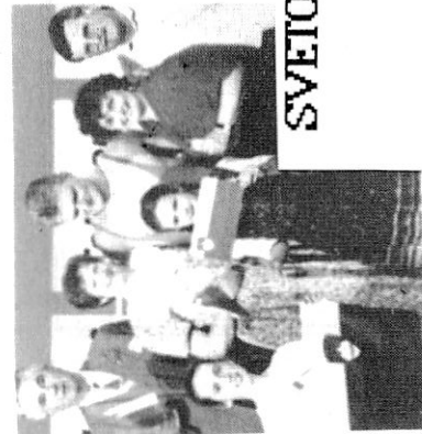
Melbournski Slovenci bojstvo Marka na svetovnem prvenstvu