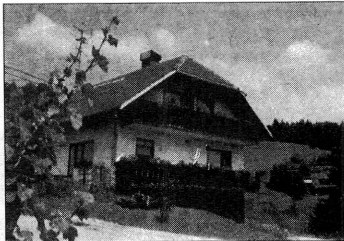
Turistična kmetija Urška je letos prejela priznanje za najbolj urejeno kmetijo v Sloveniji.